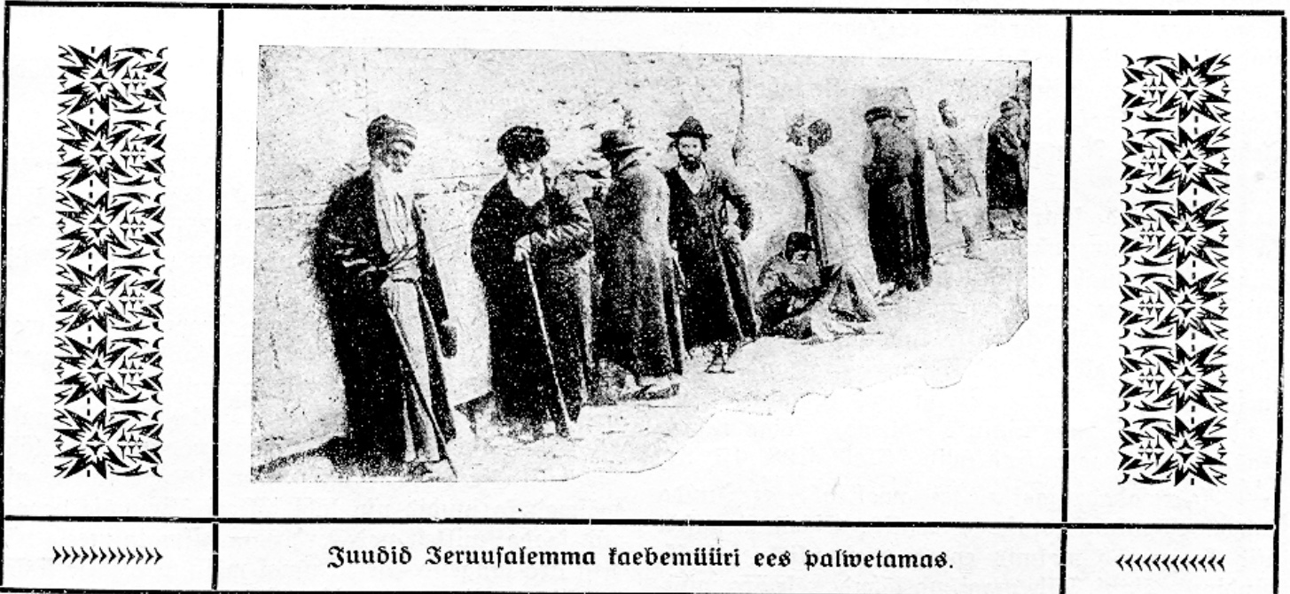
Juudid Jerusalema faebemüüri ees palwetamas.

Maastate festel on meile nii juudi rabbide kui kristlikkude jutlustajate poolt öeldud, et Junda rahwas pühale maale tagasi minewat. Juba üle 30 aasta festel on siionistide liikumine üldiselt oodatud sündmust teostada püüdnud, jaates juute tagasi Siionisse, aga miljonid juudid wiibiwad ifka weel wõõrjil. Siionismi edendamiseks kogutakse igal aastal määratumad summad kokku; wahetpidamata korraldatakse selleks pidusid ja palju muud sarnast; selle liikumise edustamiseks wäljaantawad raamatud, ajakirjad ja päewalehed neelawad enda trüffi-