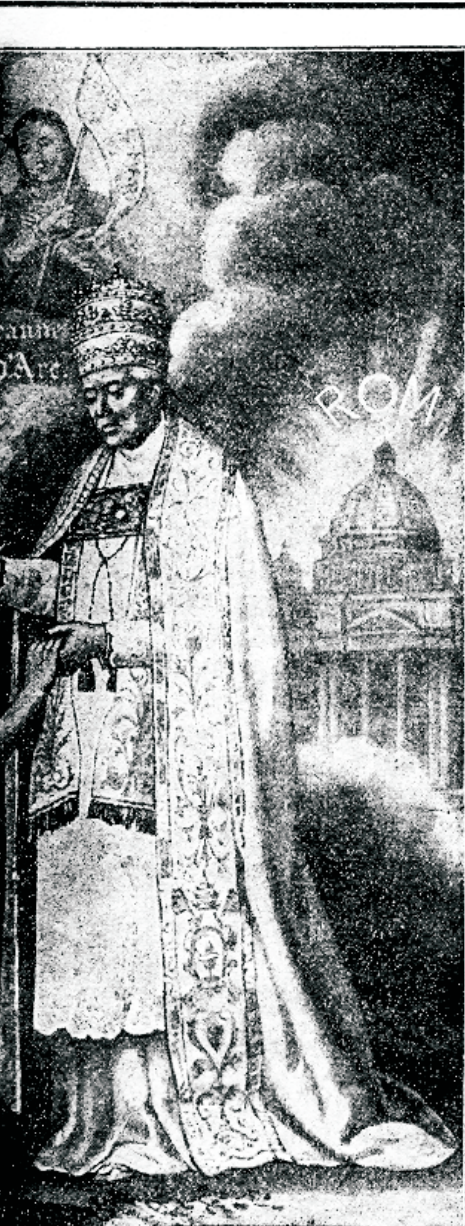
Minewifu aastafadade wõimumehed, kes kõig paawsti armust troonile saanud.