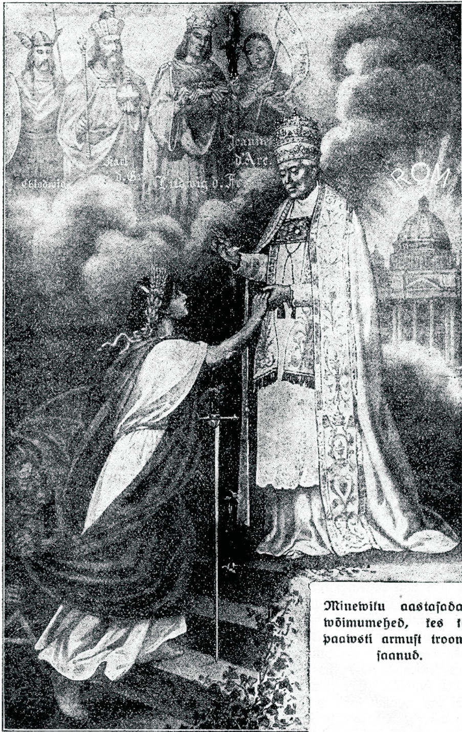
Minewifu aastafadade wõimumehed, kes kõig paawsti armust troonile saanud.