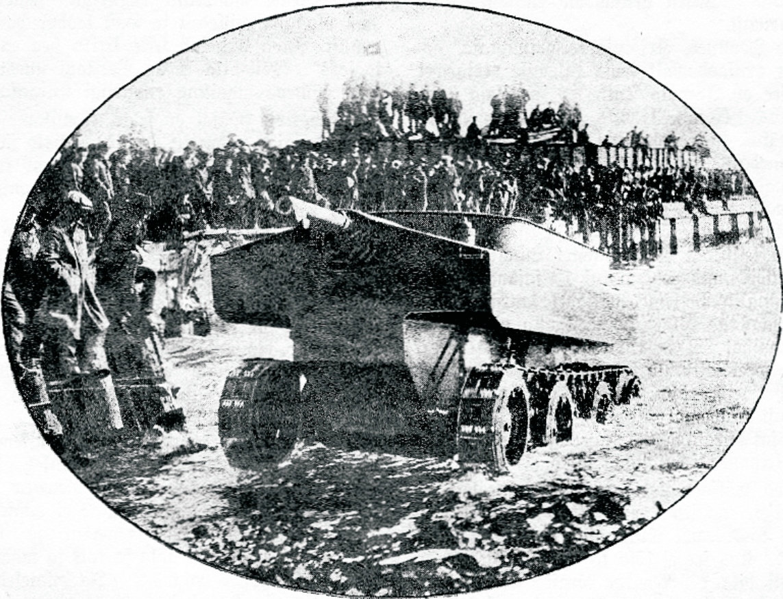
Uuemaagne tant, mis liigub maal, kuid ühtlasi ka wees paadina.

pattude päraist; paistis olema just paras töötuste täidesaاتمise aeg. — Kuid millise pettumuse tõi tema tulemine! Tuba tema sündimine ja ülesastumine tegi rahwahulga tema vastu usaldama tuks; sejt hoolimata selgetest wana testamendi töötustest oodati maapealse rahuriigi ülesehitamist. Tuhandes usklikud inimsüdamed lootsid, et jee, kes kuulutas nii wägewasti, tegi terweks haigeid ja isegi üles äratas jurnuid, ühel päewal siis