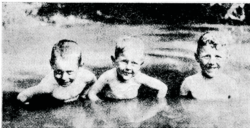
Karastaw wesi on parim weteringwoolu elustaja.

mõtetega põldude ja metsade kestel jalutus- käike teed, wõiwad need sulle suureks õnnistuseks saada. Sinu närwikawa, mis linnaelu keerus ja elumurede surwe all äärmiselt kurnatud on saab looduse rahustawa mõju läbi kosutatud. Rõõm ja rahu wõtawad sinu sifemuses aset. Meie jalutamine ei pea aga mitte „lonkimiseks“ muutuma, ei, peaks parajas kiiruses wabalt marsšima. Nii sugune liigutus kiirendab