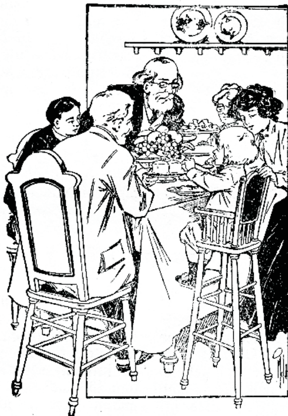
Suba lapseas rikub liigsöömine seedimise.

Kehalised rikked tekivad järsu õhu muudatuse tagajärjel, suure niiskuse wõi jälle kuuwuse mõjul, kui ka terwisewastalisse riietamise järeldusel.