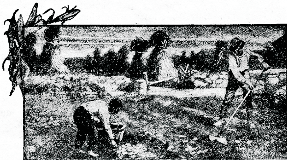
„Seepärast nende wiljast peate teie neid tundma.“

„Ja ma nägin: waata üks walge pilwe, ja pilwe peal istub üks, kes oli inimesepoja sarnane, kelle peas üks kuldne kroon oli ja tema käes teraw sirp. Ja üks teine ingel tuli templist wälja ja hüüdis walju healega selle wastu, kes pilwe peal istub: siruta sirp wälja ja lõika, sest lõikamise tund on tul-