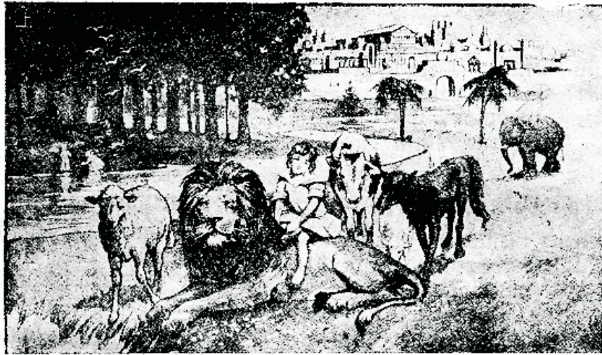
„Eht hõel inimene armu saab ei õpi ta mitte õigust; ta õiguse maal teeb ta kõwerust ja ei saa mitte Jehowa kõrgust näha.“ Jef. 26, 10.

juhtumisel on tema eesmärgid meid läbikatsumada, kas meie kõigis ustawad oleme. Muidu ei wõi tema meile jäädawat wara kätte usaldada. Kui eluraskused meid tabawad, siis peafime mõtlema, et need meie iseloomu kaswatamiseks on saadetud. Meie peafime alati eneselt küsima, kas oleme igas asjas kannatlikud ja walmis kõike kurja ärawõitma. Seda näitab usumehe, Jakobuse, mõte selgesti, kes ütleb: „Minu wennad, pange selgeks rõõmuks, kui teie mitmesuguste kiusatuste sisse satute, ja mõistke, et teie usk, mis on läbikatsumatud, saadab kannatust. Aga kannatusel olgu täieline töö, et teie wõiksite olla täiesti wagad ja ilma-laitmata ja et teil ühtegi ei puuduks.“ Jak. 1,2-4.