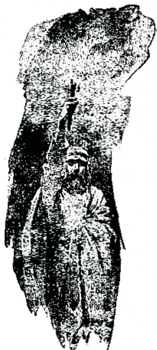
Maailmal on walguist tarwis eluteel.

Kui patt ainult pahades, jäledates tegudes peitaks, siis võiks ju õppida niisuguste tegude eest kõrwalehoidma, võiks wastu võtta kriisilikud elukombed, aga „kalduwusest“ ja „hinust“ patu järele ei suuda meid wabastada ei selgitus, kaswatus ega isegi enese armastus. See kalduwus, mis armuta orjataltsutajana meie üle walitseb, juhib isegi wäikesed lapsed veel mõistmatutele waledele ja warguste tegudele, mis siis hiljem mälestuswõime läbi teistele pattudele sillaks saawad. Sellepärast palub ka Tawet: „Ära mõtle mitte mu noore eest pattude peale“. Laul 25, 7.