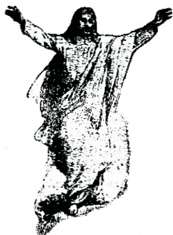
Mina olen tee ja tõde ja elu.

Maailm on hädas. Langemine paistab kõigil aladel; allapoole mineku meeleolu on igal pool tunda. Inimene on praegu enam, kui ilalgi enne tema enda poolt esilekutsutud asjaolude ori ja on elu mõiste ja eesmärgitüülikult tunda filmist kaotanud. Üksikute üksikute waimuwaesus peegeldub end loogu rahwuste nõutuses kõigelihtsamate päewaküsimuste kohta.