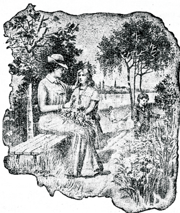
Tagasi loodusesse! peaks ikka enam ja enam inimesoo hüüdsõnaks saama.

Wõni üksik himude ori, kes oma kassinatelt wanematelt raudse kehaehituse pärandanud, wõib eht mõnikord suurustada, et tema wõib kõiki aineid süüa ja juua ja kõik terwiseaduse eeskirjad ilma nähtawa kahjuta ja hädaohuta tähelepanemata jätta; sest ei wõi aga weel järeldada, et teised seda ka teha wõiwad.