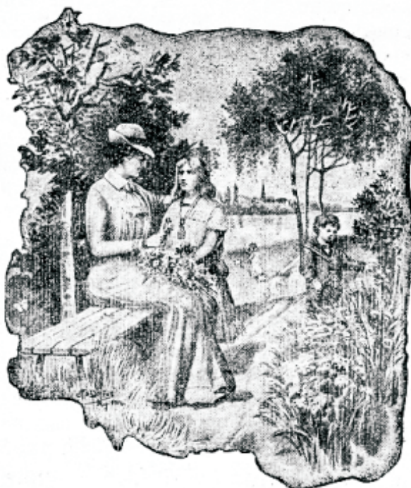
Tagasi loodusesse! peaks ikka enam ja enam inimesoo hüüdsõnaks saama.

Mõni üffil himude ori, kes oma kasinatelt wanematelt raudse tehaehituse pärandanud, wõib ehk mõnikord suurustada, et tema wõib kõiki aineid süüa ja juua ja kõik terwiseaduse eeskirjad ilma nähtawa kahjuta ja hädaohuta tähelepanemata jätta; sest ei wõi aga weel järelbada, et teised seda ka teha wõiwad.