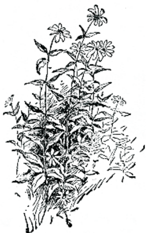
Otsesed lilled päikesse poole pööravad, nõnda on ka inimeses igatsus Jumala järele.

Inimese kõigesuurem hädaoht on selles, et tema iseennast petab, enesega rahulolekut