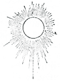
Nõnda nagu maailm ilma päikeseta õudne ja külm on, samuti on ka waimulik ilma õiguse päikeseta.

Kui tema hääduse, armu ja armastuse juures wiibidakse, siis saab mõistus selle tõe jaoks ikka seigemaks; südamel igatsus mõ- tete puhtuse järele saab ikka pühalikumaks ja kõrgemaks. Kui hing pühade ja puhtate