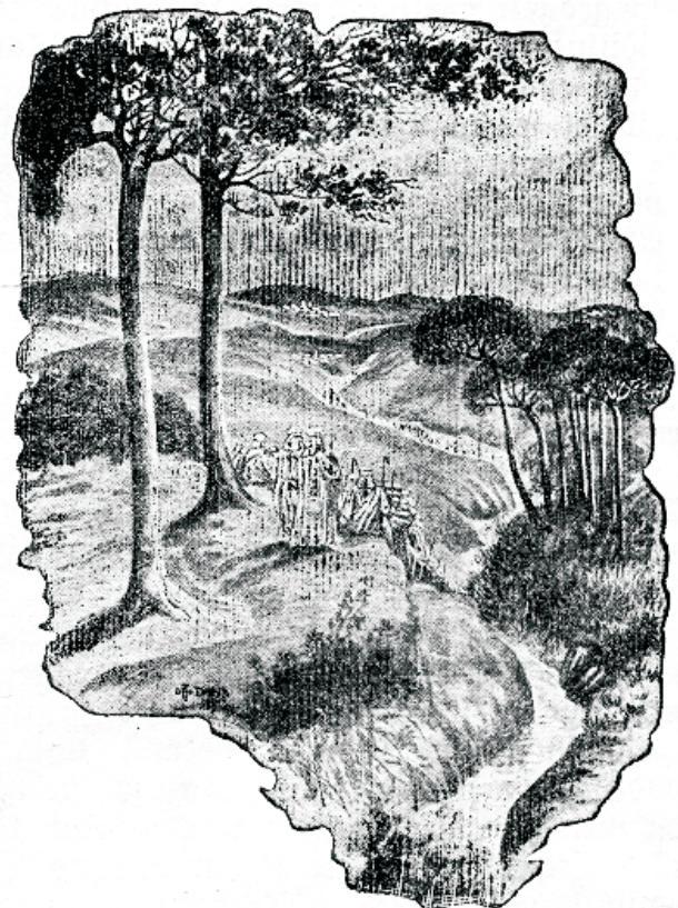
„Terwe päew oli ta rahwa hulga teenistuses, kes tema juure tulid?“

Lauluga terwitas ta hommikuwalgust, tänu- ja kiituse lauludega ülistas ta oma töö aega ja töi taewa rõõmu wäsinutele ning argadele. Oma õpetamise ametil päwil elas ta suuremalt osalt wabas looduses. Oma reised, ühest kohast teise, tegi ta jala ja palju oma õpetusi jagas ta looduse wabaduses. Ta hoidis end linna kárawikkast elust eemale, wi-