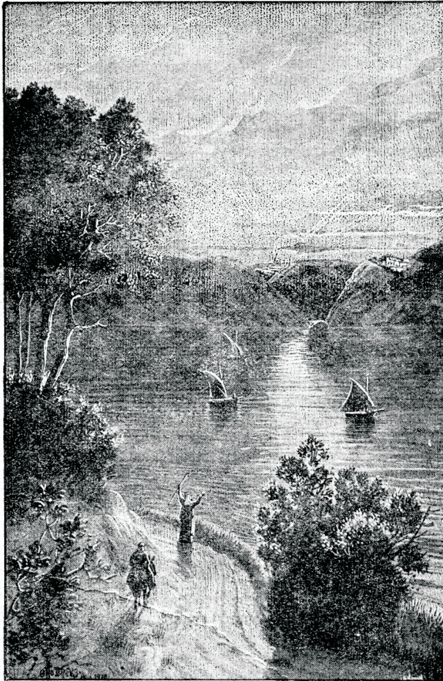
Loodus awaldaw ülendawat mõju inimese peale, tõendades Looja wägewust.

Ei ole ainsamatti inimest, kes midagi ei armastaks. Armastust ja talduwust, üks kõik