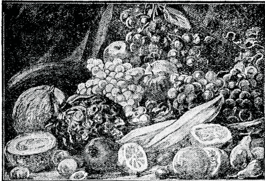
„Kõik puud, kus peal puu wili on, mis seemet kannab, see peab teile roaks olema“. 1. Mof. 1, 29.

Wäga tähtis on toorelt söödawat puuwilja