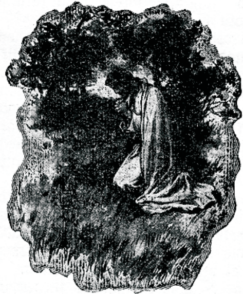
Sagedasti leidis hommit teda kufagil üfildufes palwetamas.

Kui need waeised, kes nüüd linnades kofkufurutult elawad, endale maale eluaseme leiad-