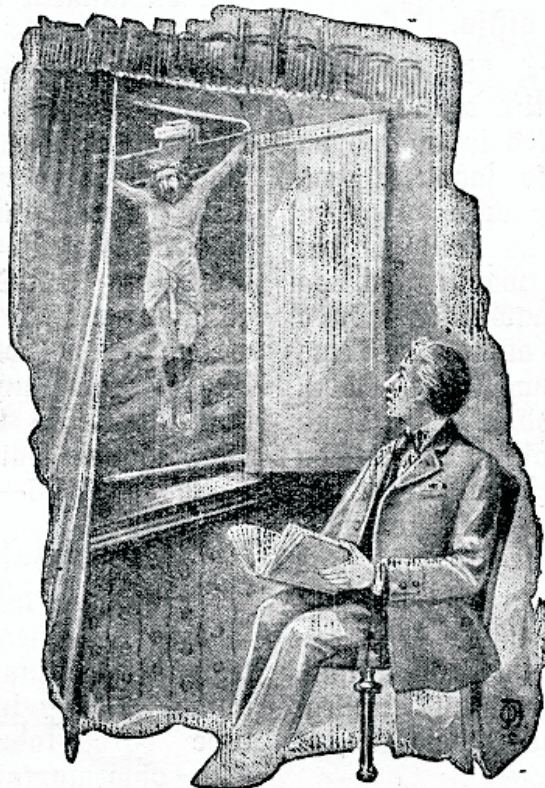
Mõtteid Kristuse peale hoides muutame tema sarnasteks.