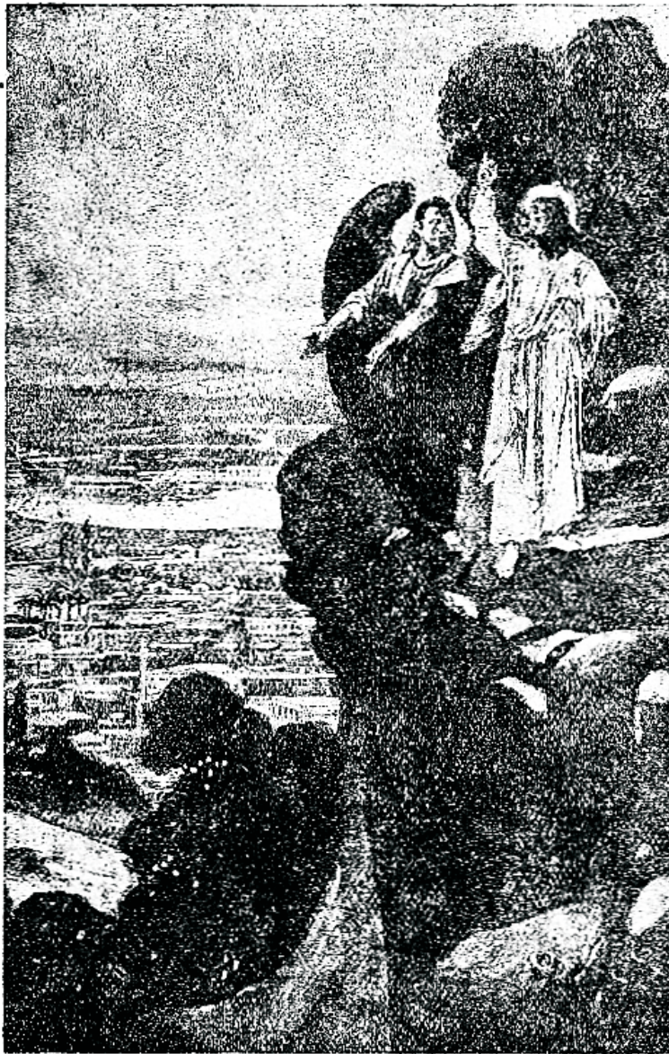
Kummarida ja sa omandad kõik.

Kumbki neist waadetest ei ole õige. Saadan on tõesti isiklik olewus ja tema oli kord üks kõigeülem, püha ingel. Ta on ka pragu weel üks ingel. Jumal lõi teda kord inglina, sellepärast jäi tema ka oma langenud olekus inglisk. Piibel nimetab saadanat mitmel korral ja annab temale sagedasti uued nimed, nii kui: saadan, peeltsebuul, wana