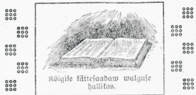
Kõigile kätte saadaw walgu hallitas.

Tähtis on ka selle aasta algusel iseäralikult tõsiselt selle pääle mõelda. 1924 aasta palub jällegi igale ühele uuesti, nii kaua kui armu aeg kestab, wõimalust inimese joo parema sõbraga tutawaks saada ja end kindlamalt Jumala sõna pääle toetada.