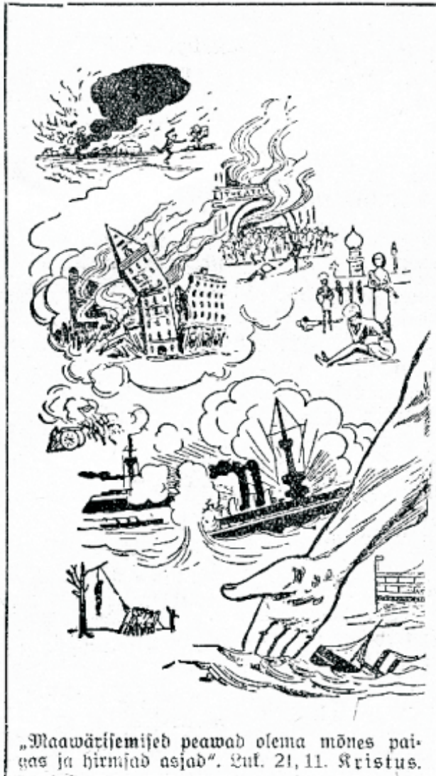
„Maawärilemised peawad olema mõnes paigas ja hirmsad asjad“. Lul. 21, 11. Kristus.

Mitmed kümmed majad muuli ääres olid wilku, langelid rusudeng kokku ja mõned wajufid täiesti maa alla. Palju rahwast, kes enda omaid ja sõpru olid saatma tulnud, olid parajasti muuli peal seisnud, lahtuwatele südamlike õnnesoowe kaasa hüüdes.