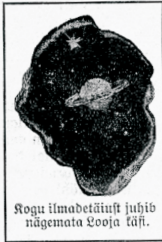
Rogu ilmadetäiust juhü nägemata Looja läü.

fesse lahkkelid sünnitanud ja häda ning wilestust wiimase wõimaluseni suurendanud. Kas Piibel meile siis ka sellest seisukorrast wäljapääsu teed ei näita? Ja, kindlasti! Kuid selleks, et ta meile õige tee näitajaks wõiks olla, peame ise eneste seisukohta muutma.