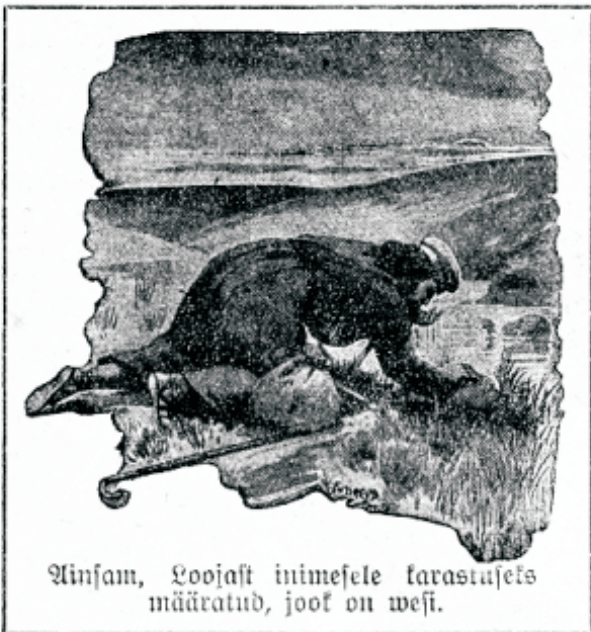
Wanam, loojast inimesele karastajaks määratud, jook on wesi.

Kurwameelsus segab mao loomulikku tegevust ja mõjutab, et toit meie seedimiskanaalis ainult aeglaselt edasi liigub.