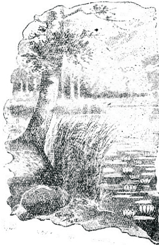
„Pange tähele lilleteji taewa all, kuidas nemad kaswawad.“

Need kurnawad meie rammu. Need rõõiwad meilt rõõmu ja tumestawad meie meelt. Mis küll ei annaks meie selle eest, kui teegi meid muredest wabastaks? Siin on ainjam abinõu selle eesmärgi kättejaamisteks. Jumal on seda töötanud ja mis tema on ütelnud, seda täidab tema ka: Aga nõudke esite Jumala riiki ja tema õigust, siis seda kõik peab teile pealegi antama. Meie tunneme seda iga päew, et kui meid mõni suurem mure tabab, siis kaowad kõik wäiksemad mured — mis meid seni maani allardhustid — nagu eesenesest eemale. Kõik meie mõtted on koondatud selle suurema mure