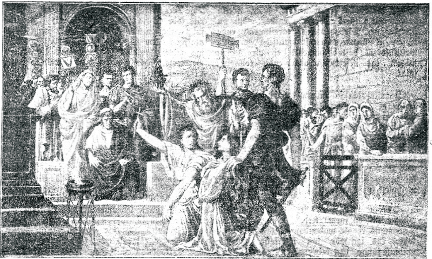
„Rahku piibli tõest ja sumarda ebajumalate ette eht — sure!“ Endised kristlased walisid eunem surma kui, et Jumala sõna õpetustest oleksid taganenud.

Kuigi piibel on küis hoiatusi wale õpetajate eest, on siiski paljud walmis sel wiisil enda hingede hoidmist waimulikkude kätte usaldama. Tänapäew on kristlaste hulgas tuhandeid, kes ei wõi anda mingit teist põhjust usupunktiide jaoks, millede poole nad hoiatwad,