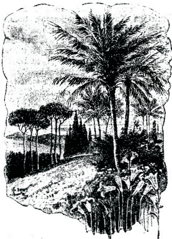
„Inimesel, kes naesest sündinud on lühikesed elu päewad ja tüli küll. Ta tõuseb kui lillele, ja leigatakse ära.“ Jabi 14, 1—2.

Õsgei see inimene, kes unerohu mõjul tund-