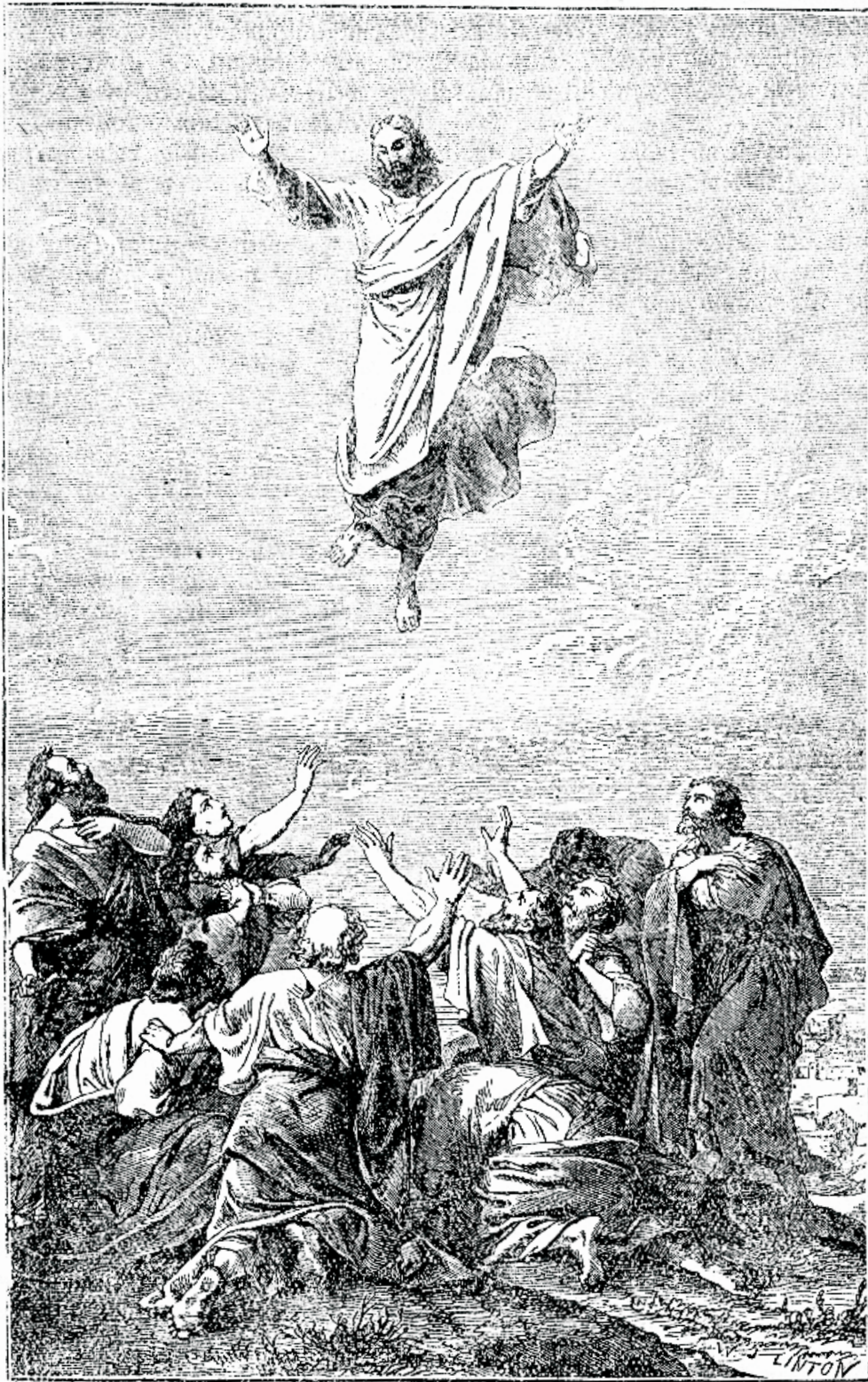
Kristus tuleb seljamaal nähtaval kombel, kui teda üles võeti taeva.

mad peavad teda nägema." Paulus tõendab Kristuse isiklikult tulekut sõnadega, mida võimata teistele mõista: „Sest Issand ise tahab taevast maha tulla taevast sõjakäändamise, peaingli hääle ja Jumala pööratuna ja kes Kristuse sees on surunud, need peavad üles tõusma esmalt. Pärast peab meid, kes meie elame ja üle jääme, ühtlasi nendega pilweteeses ristama