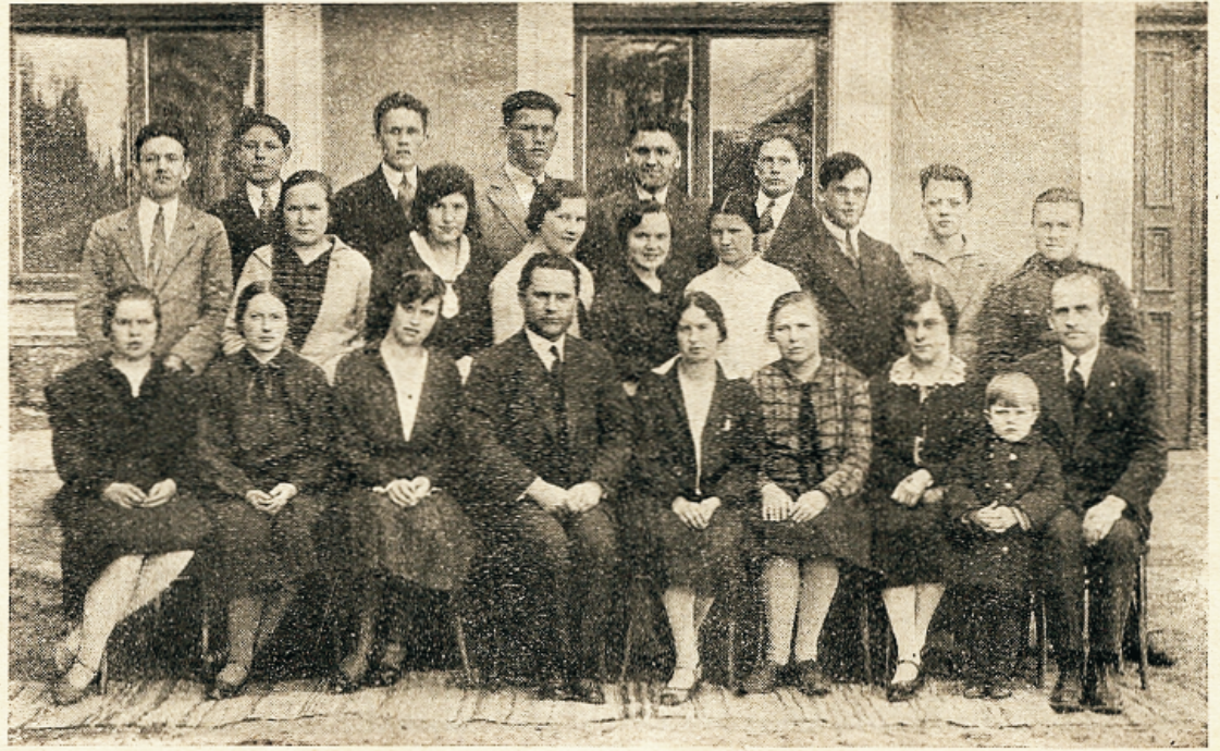
Seminari õpilased Kuuramaa liidust.

mid ja näinud, et olete püüdnud teha oma parimat, et meile meie elus anda kindlat toetuspunkti, näidata allikat, millisest võime saada karastavat wett, ehitada teenäitajat, mille järele oma elus käima peame.