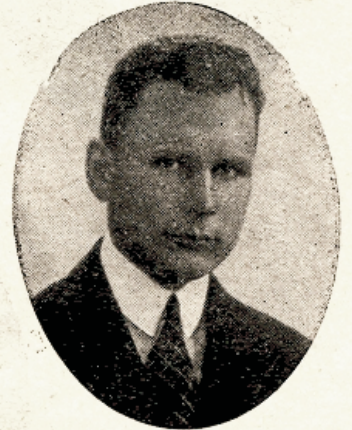
E. Teesnes Piibli ja ajaloo õpetaja.