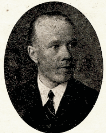
K. Brutan Looduseteaduse ja lätikeele õpetaja.