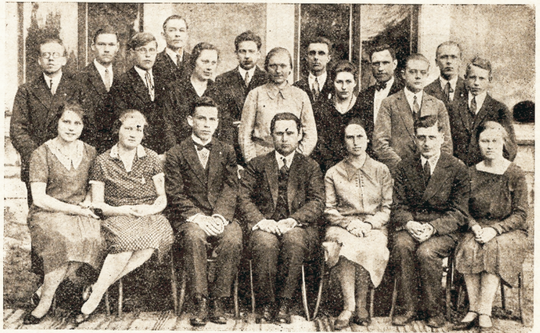
Seminari õpilased Eesti liidust.