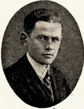
A. Kippur Matemaatika ja füüsika õpetaja.