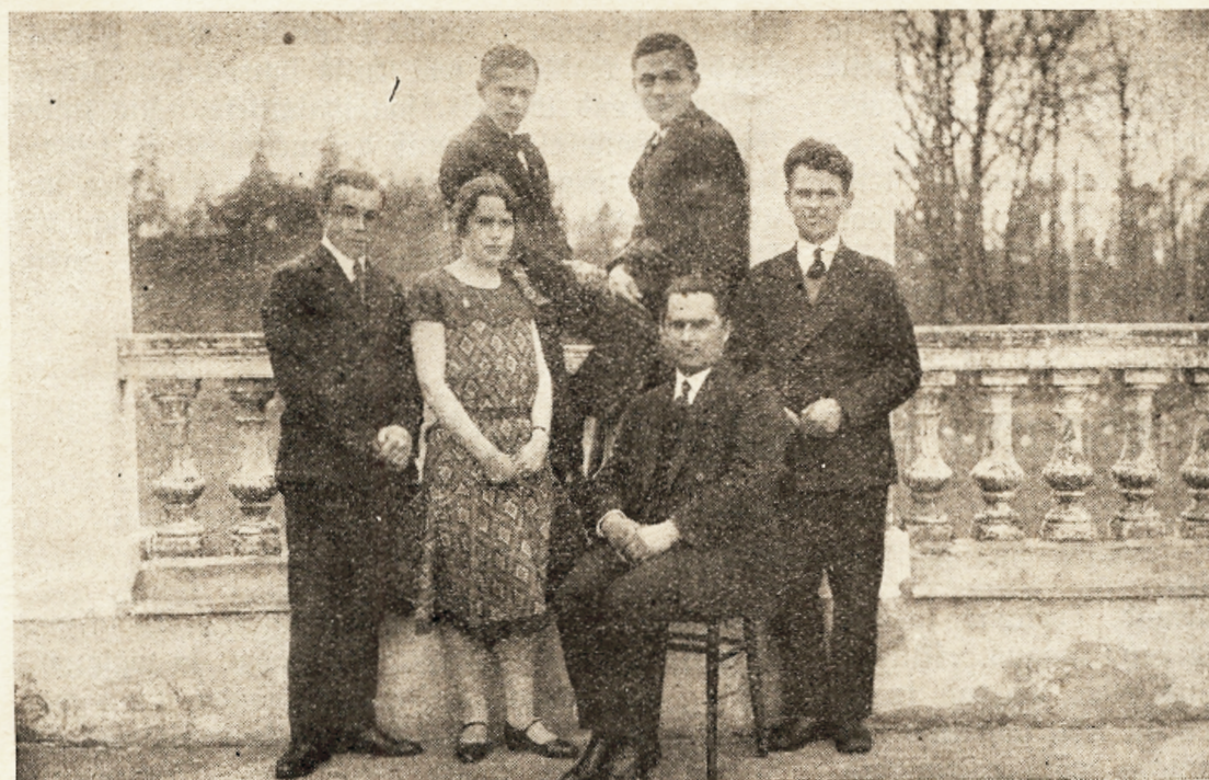
Seminari õpilased Riia liidust.