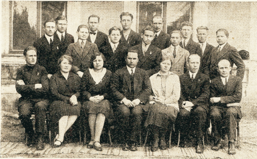
Seminari õpilased Liivimaa liidust.

jid tähenduses meie jaoks need mõlemad nimed. Palju manitsusi, palveid ja pisaraid, nii mõnigi südamlik soov on seotud nendega ja on teinud meile jeda pühimaks ja kallimaks wanemate nimed. Andestage, kui meie alati ei mõistnud hinnata teie armastust ja tegewuspõhjuseid; tuli lahkimistund, mis avas meile silmad selleks kõige kallimaks omanduseks; tulid tunnid, kus meie seifime ükfinda omas nõutuses ja oma muredes, tunnid, mis lasksid meid tunda, mis tähendab olla lahutatud wanematest; tulid ka tunnid, mis andsid meile võidu mõtte juures kallitele wanematesõnadete: „Minu laps, ma palun sinu eest“. Ja, et meie siin selles koolis võisime omandada kõrgeimat warandust, Jumala sõna, jeda tänane Jumala kõrwal teile, armsad wanemad!