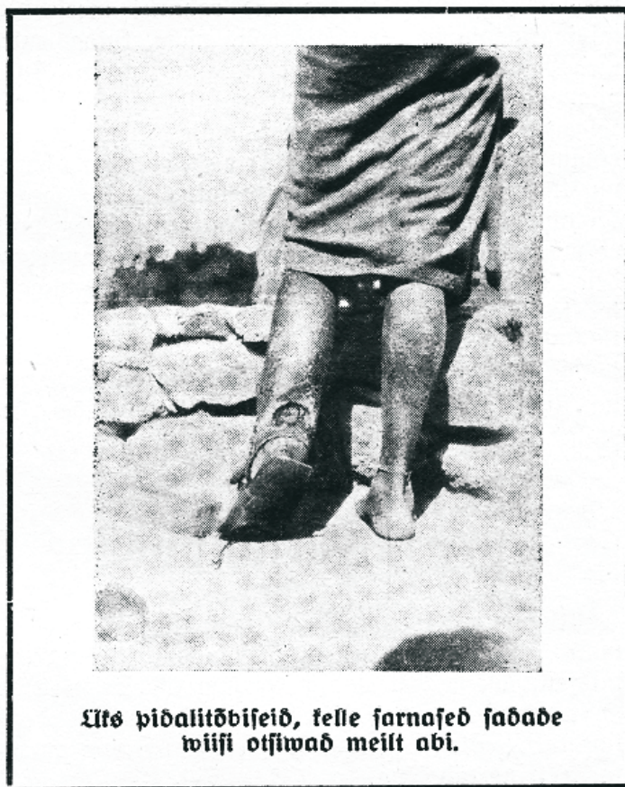
Üks pidalitõbiseid, jelle farnased jabad wiiji otsiwad meilt abi.

asja weel pahemaks. See on koht, kus meie arstlik misjon on hädatarwilik, mitte ainult, et wähen-dada ihulikku kannatust, waid, et inimesi walgustada ka tõe walgusega ja näidata neile, kuidas hoida kõrwale nende hirmsatest haigustest. Arstliku misjoni tööpõld Aafrikas on väga suur. Siin on väga hinnatud arstmisjonär, sest tema wõib teha rohkem kui keegi teine.