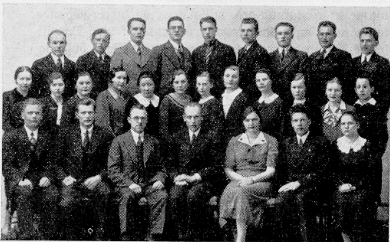
Meie misjonikooli õpetajad ja õpilased 1936/37. õppeaastal.

Wuidugi koolist lahkudes ei ole lõppenud töö. Elukohustused ei ole lõppenud. Eluiftest wabaneme alles siis, kui üfksford elutee on käidud. Koolis me oleme õppinud teadma jeda, et me weel ei tea midagi. Koolis oleme aimanud wajadust teadmiste järgi. Nüüd peame edasi minema, peame ifet kandma ja õppima ifet kandma.