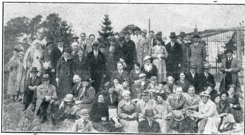
Tallinna WB-lased ühes mõningate soomlastest kaasvõitlejatega.

Tallinna foguduste noored te- gid nelipühade ajal külastäigu Helsingi fogudusele. Külaskäi- gust osavõtjaid oli üle viieküm- ne. Me läksime soomlastele wii- ma peasjalikult eesti laulu. Ja nii viidasimegi kaks muusikaõh- tut, ühe — Helsingi konserwa- tooriumi saalis, ja teise — fogu- duse oma palvelas. Koori ju- hatas W. Schön.