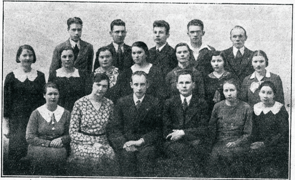
Meie misjonikool esimese õppeaasta lõpul.

Meie kui rahwas ja organisatsioon wõime olla ka rõõmsad, et meil on awanenud wõimalusi, kuidas oma igatsust teadmiste järgi rahuldada. See wõimalus on meie antud läinud aastal awatud misjonikooli näol, mis jatkab oma tegewust ka 1936./37. õppeaastal. Kui warem misjonikooli puudumise tõttu Gestis oli raske teostada igatsust, mis nii waljusti rinnas tuffus, siis on selle teostamine nüüd palju fergem, sest me omame oma kodumaal kooli.