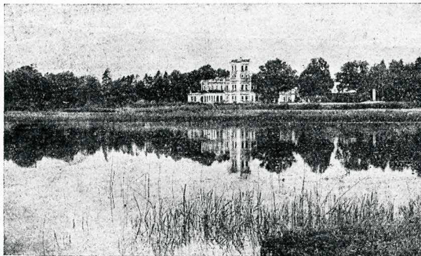
Adwentmisjoni Seminar Lätis.

kogudustel on kristliku kasvatusle jaoks raha ja hääd tahet, siis lööb ka kool õitsele. Tõeliselt ei peaks see nii olema. Seminari hääkäik peaks olema rajatud kristliku kasvatusle astmeil. Kõrgem õppeasutus võib ainult siis saanutada soowitud tagajärgi, kui aastate ning klasside järgi korraldatud õpilased kasvawad loomulikult õppimistes.