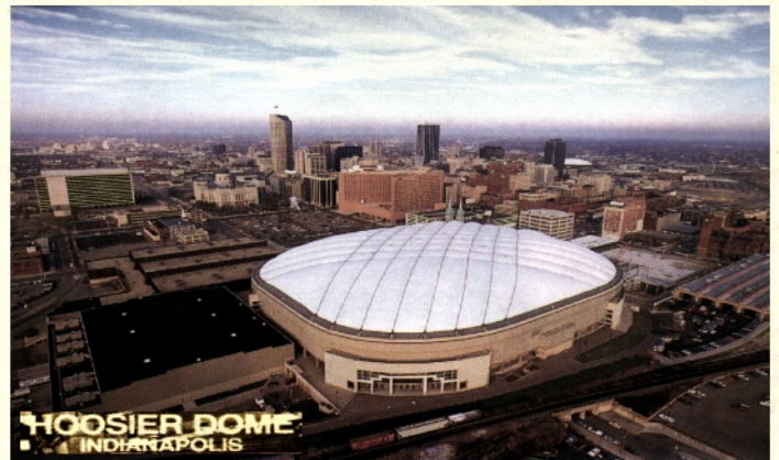
Esiplaani Indianapolisi Spordihall, kus toimusid 55. Peakonverentsi istungid