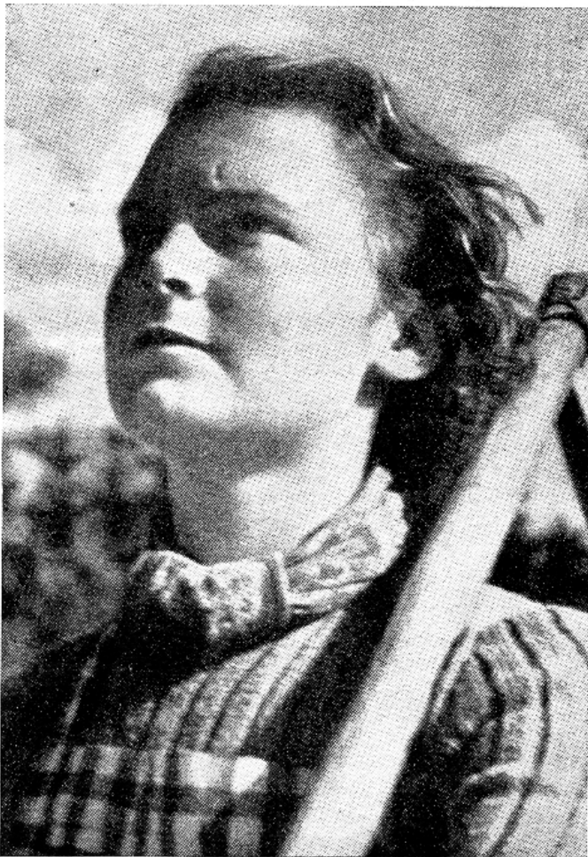
TÖÖ ANNAB INIMESELE VÄÄRTUSE

Kui halba tööd tehakse raha pärast! Kui halba tööd tehakse selle pärast, et inimesed ei arenda läbisaamist üksteisega! Kellel on jõukust, ka see ei tee midagi oma vähema kaasiniemese heaks ilma tasuta. Kui palju nii mõnedki inimesed suudavad, aga kui vähe nad teevad