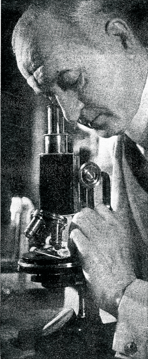
Tänapäev käib hoogne töö kõige olemise saladuste selgitamiseks. Võidakse kindlaks teha suur järjekindlus ja seaduspärasus looduses. Sellega on õieti saanud mõistetavaks, et kõik on rajatud kõrgema vile ja mõistuse poolt

maailma kõikvõimsa Looja käsi?.. Mis ütleb see, kui vahetevahel toonitatakse, et elu võib olla tulnud teistelt taevakehadelt?.. Suur mõistatus pole sellega ühegi täpi võrra rohkem lahendatud; ikka jälle küsime elu alguse üle, kas ta tuli planeet Siiriuselt või mõnelt planeedilt teispool Linnuteed?"