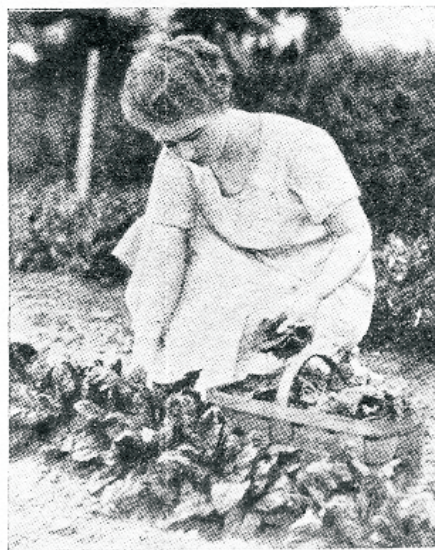
Juba annab loodus meile värsket toidu.

Kes meist ei ole viibinud võõras ümbruses ning tundnud nagu oleks seal kõik püüdnud meie isikut kokku suruda, meilt vabaduse röövida ning meid tunnetega pigistada. Kuidas ihkame võõras kohas, et oleks keegi, kes võiks midagi seletada ja näidata. Kuidas me siis vabaneme teadmatuse pingest. Kui kergeks muutub meie tunne, kui leiame võõras kohas tuttavat. Nõnda ongi loodus meile lähedane ja armas, sest igal pool leiame seda, mis on tuttav ja kasulik. Ei ole midagi paremat kui kodumaa loodus. Seal teame, et see on kägu, kes kukkub, ja lōoke,