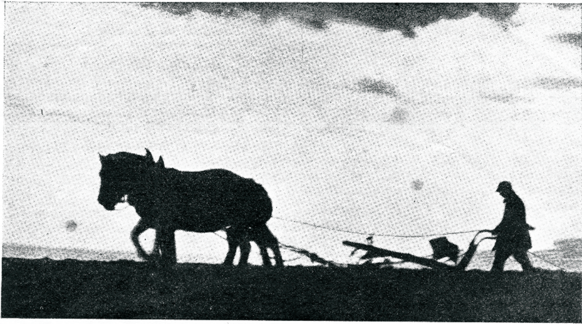
Põllumehe jala jälgede kohale võib saada lokkavat vilja.

kes lõõritab. Kas võib mingi võõras häälightsus olla veel ilusam? Ei iialgi mitte! Millise rõõmsa tundega võime vaadelda käosilma, ülast, kullerkuppu ja nimetada neid nime järele. Sest ainult teadmine võib meid rahuldada.