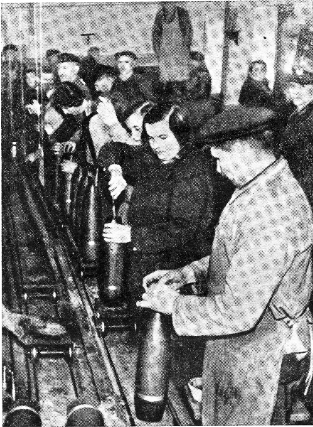
KA TÖÖ . . .

Teine väga õrn koht asub Vahemere idaosas, kus Süürias ja Palestiinas on moodustatud Prantsuse kindrali Weygandi juhtimisel iseseisev armee. Selle armee sihtide kohta on tehtud mitmesuguseid fantastilisi ennustusi, nagu tungimine Nõukogude Liidu õlitsentrumi Bakuusse, kust lähevad õlijuhtmed Musta mere kaldale ja sealt kaudu saab Saksamaa õli. Teine versioon räägib tungimisest üle Kreeka ja Bulgaaria Rumeeniasse, et ära lõigata Saksa kaubandust. Igatahes on liitlastel sealset armeed hädasti tarvis oma-