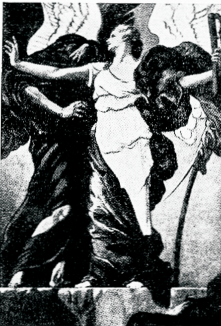
Võitlus valguse ja pimeduse vahel.

Üks päev aastas oli aga eriline päev. Seda nimetati suureks äralepitamise-päevaks. Selle