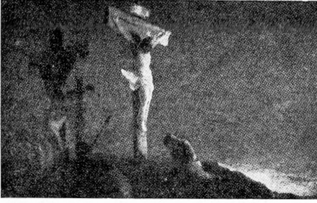
Me kõik oleme eksinud. Aga Kristuse ohver on meie lepitus Jumala igavese õiguse ees.

seesama peab su pea rõhuma!“ Milline suur töötus ja kindel otsus! Nii asetab Jumal saatana plaani vastu oma lunastusplaani, mille mõtte on anda kõigile, kes usuvad, igavene elu.