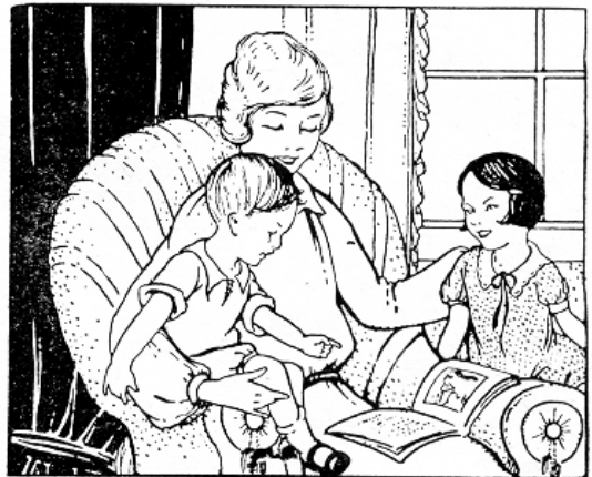
Kodu on kõige armsam paik.

Kristlikus kodus peab õpetatama ligimese teenimist. Maailmas valitsevad hädad ja haigused pakuvad selleks suuri võimalusi. Lapsed õpivad tundma ja hindama teenimise väärtust mitte kusagil mujal kui oma perekonnas ja naabruses. See õpetab neid tundma jumalikku tõde, et „õndsam on anda kui võtta“. Aidates kodus isa ja ema, kasutades iga juhust rõõmustada oma õdesid-vendi ja olles teenimisvalmis vanade ning haigete toetamiseks, nad saavad maitsta õiget elurõõmu. Seda teostada on kristliku kodu ülesanne.