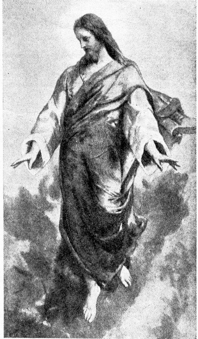
Kristus on ära võitnud surma ja haua. Ja ta võib ka meile anda elu.

Ja siis lausub Kristus: „Lapsukesed, mina olen veel üürikeseks ajaks teie juures, küll teie otsite mind, ja otsekui mina Juuda rahva vastu olen ütelnud: „Kuhu mina lähen, sinna ei või teie mitte tulla, nõnda ütlen mina ka nüüd teile!“ Joh. 13, 33. Mida siis tähendab see ütlus? Kas meie ei saagi minna ühes Jeesusega? Ka meie ei saa taevasse? Neis Kristuse sõnus on suur tõsidus. Selle salmi juures muutub meile veelgi tähtsamaks Kristuse taevassemineku mõte.