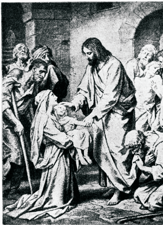
Kristus käis kõik maa läbi, kuulutas evangeeliumi ja tegi haigeid terveks.

Ta võttis osa rahva suurtest igaaastastest pidustest, ja seal ta võis rääkida väliseist tseremooniaist kütkestatud rahvale taevaseist asjadest ja igavestest väärtustest. Kõigile tõi ta midagi tarkuse varakambrist. Ta rääkis neile nii lihtsas keeles, et nad pidid teda aru saama.