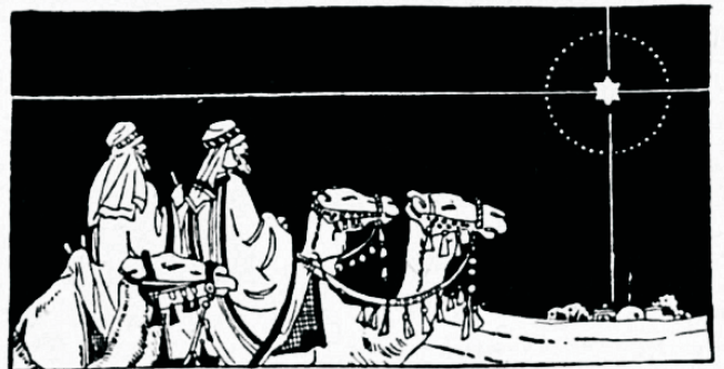
Targad Hommikumaalt tulevad Jeesust kummardama.

Need targad olid uurinud heebrealaste pühi kirju ja jõudnud veendumusele, et töötatud kuninga tuleku aeg pidi olema lähedal. Kui nad aga nüüd nägid taeva looduslikku tähte, siis nad mõtlesid kohe Piileami ettekuulutusele ja otsustasid alata reisi tähe suunas. Nad läksid välja usus, nii kui vanasti Abraham, teadmata kuhu nad välja jõuavad. Nad võtsid oma reisi peasihiks Juudamaa pealinna, Jeruusalemma. Jõudes sinna me loeme Pühakirjast nende reisi tulemusest: „Vaata, siis tulid