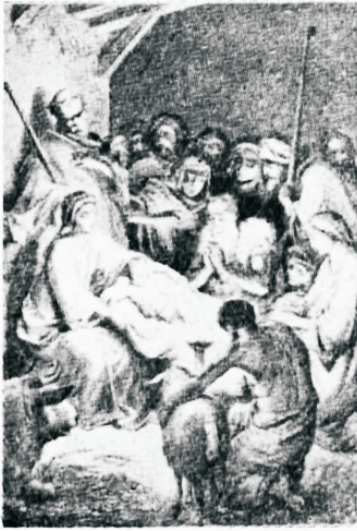
Karjased leiavad Jeesuse söimes magavat.

las neilt, kus Kristus pidi sündima. Nemad ütlesid temale: Petlemas Juudamaal; sest nõnda on kirjutatud prohveti kaudu: Ja sina Petlem, Juudamaal, ei ole mingil kombel vähem Juuda vürstide seast, sest sinust lähtub Valitseja, kes mu rahvast Iisraeli hoiab kui karjane. Siis kutsus Herodes targad salaja ja uuris neilt hoolega aja, mil täht oli ilmunud. Kui nemad olid kuningat kuulnud, läksid nad teele. Ja vaata, täht, mille nad olid näinud hommikumaal, käis nende ees, kuni ta tuli ja seisatas üleval seal kohal, kus oli lapsuke. Aga tähte nähes said nad üliväga rõõmsaks. Ja nad läksid sinna kotta ning nägid lapsukese ühes Maarjaga, tema emaga, ja heitsid maha ning kummardasid teda ja avasid oma varandused ning tõid temale andeid, kulda, viirukit ja mirri.“ Matt. 2, 1—11.