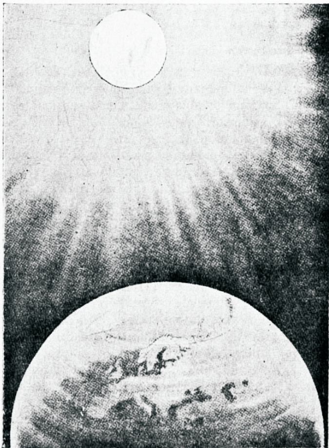
Endiselt puistab päike oma valgusekulda; ainult inimeste teod heidavad sügavaid varje...

kui ennast. Siis ongi maailm jõudnud selleni, mida ta nüüd vääril teel tahab omandada. „Kõik, mida te tahate, et inimesed teile teevad, tehke ka neile,“ ütles Kristus. Siis armastaksime oma kaasinimesi samuti, nagu tahame, et nad meid armastaksid. Siis annaksime teistele osa oma varandustest, nagu tahame, et nad meile annaksid. Ja sedasama teeksid ka teised meiega. Siis annaks üks riik teisele oma rikkusest, nagu ta tahab, et talle antaks. Kõik oleksid õnnelikud ja kõik saaksid sedasama, mida nad nüüd taotlevad vägivallega. Ja omakasupüüd, vaen ja kurjus oleksid kadunud. Asjata ei hävitataks kallist inimelu ega varandusi. „Armastage oma vaenlasi. Anna sellele, kes sult palub. Ja sellele, kes tahab sinuga käia kohut ja võtta su vammuse, jäta ka kuub.“