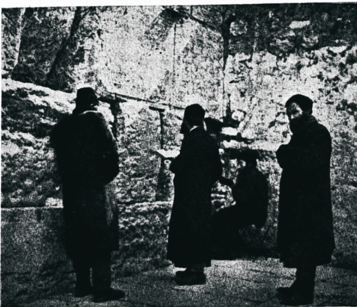
Templist järele jäänud müür, n.-n. nutumüür, kus juudid käivad kurtmas Jeruusalema linna ja templi hävitamist.

Issand on korduvalt kuulutanud needust, mis pidi tulema mitte üksnes elanikkudele, vaid ka nende maale, kui nad ei pööra ümber. Ta ütleb prohvet Jeremia läbi: „Sest et teie ei võtnud kuulda minu sõnu, vaata, ma toon siia kõik põhjamaa suguvõsad, ütleb Jehoova, ja läkitan Nebukadnetsari, Paabeli kuninga, oma sulase