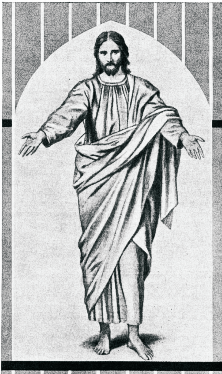
„Mina olen tee, tõde ja elu“

Kui kõik on uueks loodud, siis tuleb maha ka Jumala linn, uuendatud maailma pealinn. „Ja mina, Johannes, nägin püha linna, uue Jeruusalem maha tulevat...“ Ilm. 21, 2. Siis on saabunud aeg, millal Jumala riik on lõppkujuliselt siin maa peal uuesti üles ehitatud. Õigete suust, kes on oma südames nii kuumalt selle järgi igatsenud, kõlab juubeldav rõõmuhüüd: „Näe, Jumala telk on inimeste juures!“ Nende