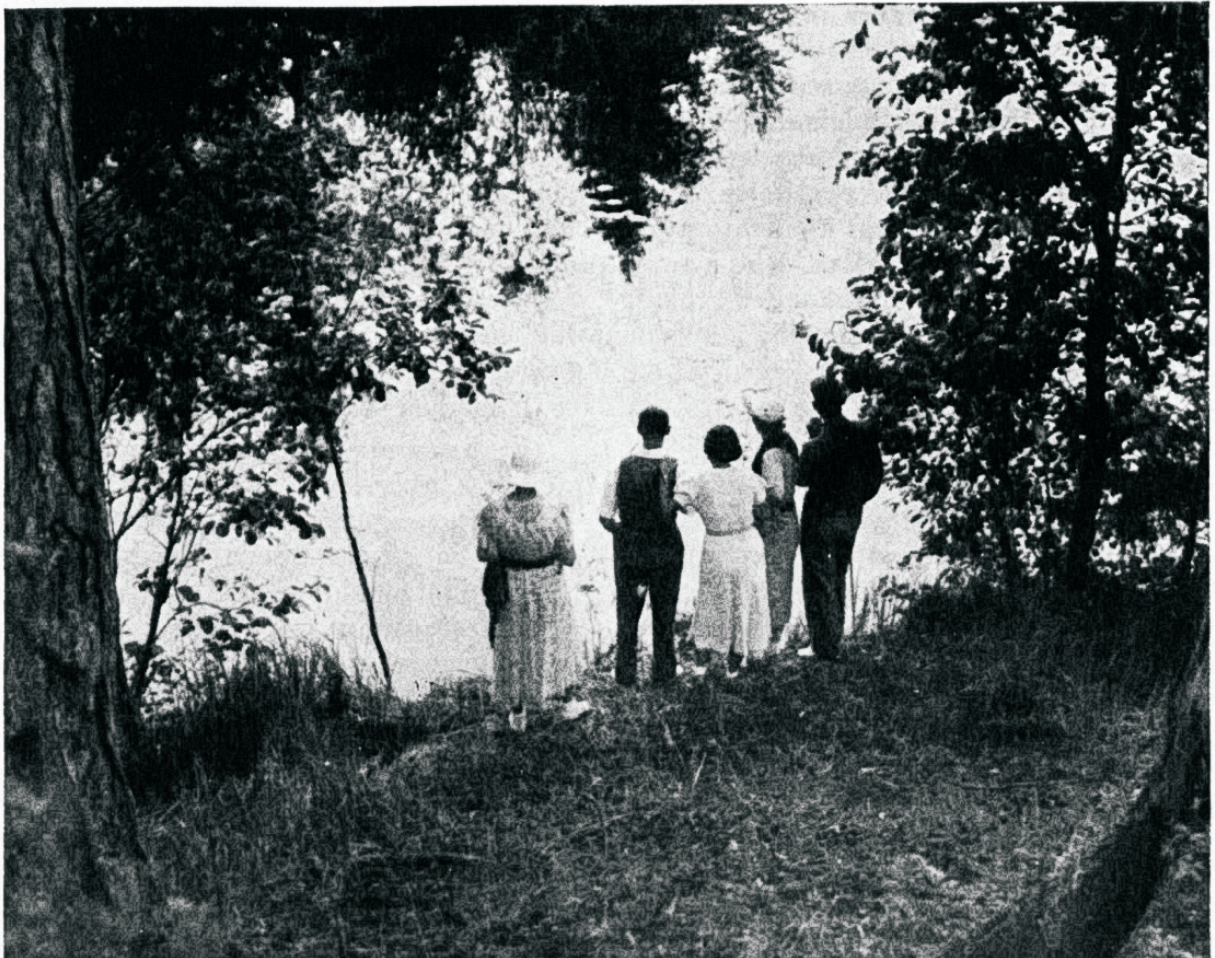
Välja vabadusse ja valgusse

Kevadel ja suvel on meile eriline kutse loodusele. Võtkem siis vastu seda, mis meile pakutakse.