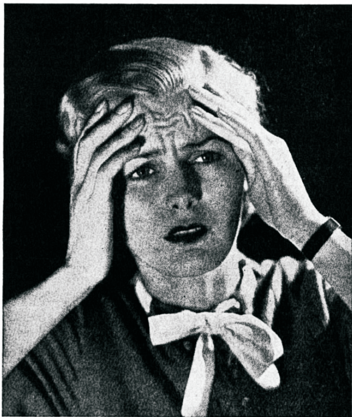
Jäta kartus, kaob valu!

Aju mitte ei võta teated kõigest kehaosadest, vaid ta saadab ka välja teateid ja paneb muskliid liikuma, või paneb südame kiiremalt või aeglasmalt tuksuma. Kui teade, mis tuleb silmast ajusse, ütleb, et keha lähedal on uss, siis aju saadab musklikele teate ja sunnib keha väga kiirelt tõmbuma eemale. Kui sõrmenärv viib teate peaja seljaajusse, et sõrm puudutab midagi tulist, siis peaja ja seljaaju otsekohe käsevad käemusk-