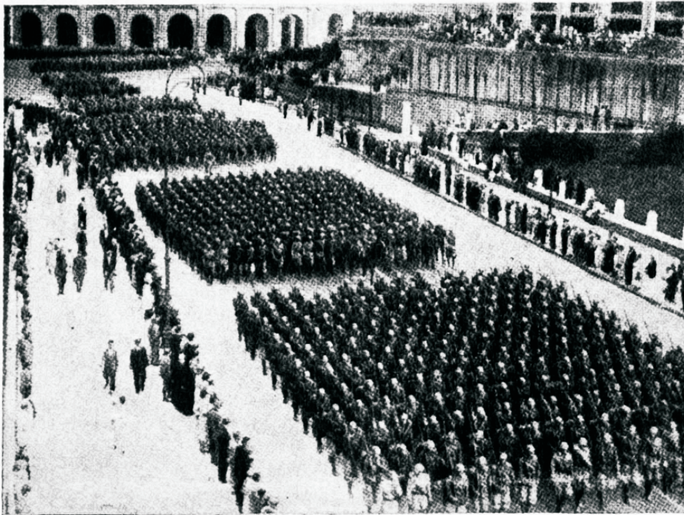
Jõudude suurenedes kasvab vastolu maailmas.

Inimeste vahel ei olnud nii suurt erinevust. Inimesed olid üksteisest lahus ja moodustasid inimkonna nagu iseseisvalt kasvavad puud moodustavad metsa. Metsas on küll mõni puu suurem ja varjab teist, kuid ei ole üldist hävitusi. On küll vastolu, aga mitte pinev vastolu.