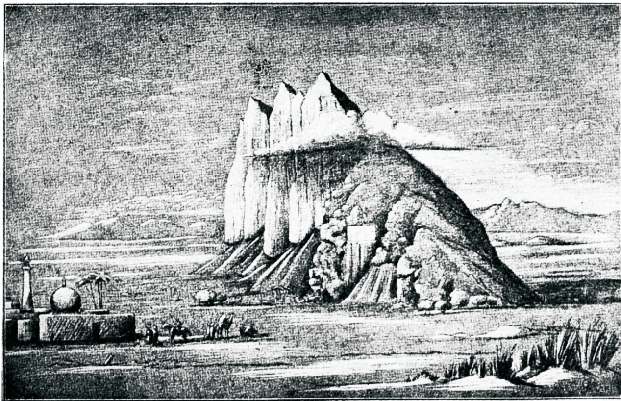
Behistani kalju Pärsias, 550 m kõrge. Kaljusse on raiutud susiani, pärsia ja babüloonia keeles aruanne Pärsia kuningas Darciose võitudest.

„Mooses ei ole kirjutanud Pentateuchi (5 Moosese raamatut), sest sel ajal ei tuntud üldse veel kirjakunsti,“ juubeldasid Piibli vastased. Kuid Piibli Jumalal oli tagavaraks kaks „kivi“, mis ootasid aega, mil nad kisendaksid, et Piibel on tõde. Napoleoni sõjakäigu ajal leidsid mõned ohvitserid Egiptuses Rosette'i linna läheduses musta basaltkivi. Sellel olid raidkirjad kreeka-, hilis-egiptuse ja vana-egiptuse keeles. See kivi andis võtme hieroglüüfide mõistmiseks. Vajati veel teist võtit — võtit, mis oleks avanud vana-babüloonia kiilkirja. Behistani kalju, mis avastati Pärsia Kurdistanis, kandis samuti kolmekordset kirja, millest üks näis olevat vana-babüloonia iseloomuga. Inglise ohvitser, sir Henr Rawlinson, kirjutas ära need kirjad. Pärast hoolikat uurimist selgitati ka see kiri.