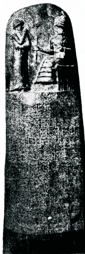
Babüloonia kuninga Ham-murapi seaduste tahvel.

„Pole olnud Hiti rahvast,“ hüüdsid kord kriitikud. Arheoloogia vastab sellele süüdistusele määratu hulga tõendustega, et on olnud säärane riik kauges minevikus.