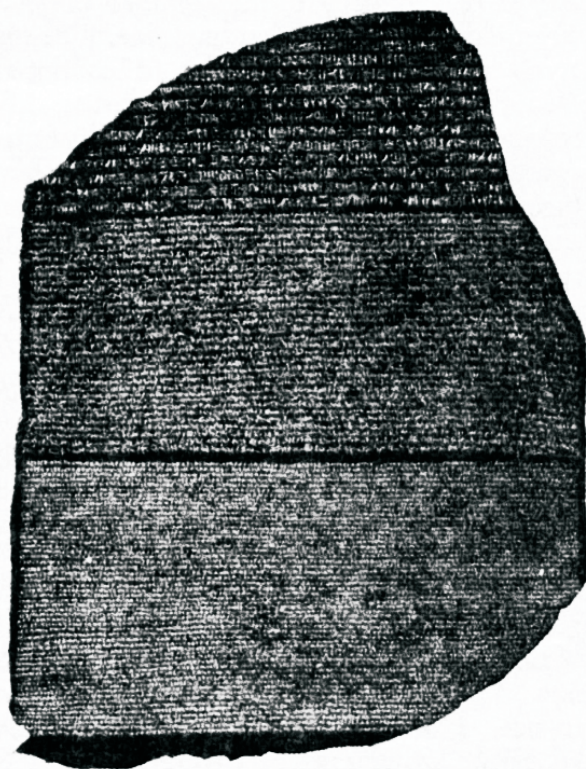
Rosette'i kivi, mis sisaldab vana-egiptuse (hieroglüüfide), hilis-egiptuse ja kreeka kirjad.

2050 e. Kr.) käsud ja seadused. See Hammurapi polnud keegi muu, kui Piibli Amravel, kellest kirjutab 1. Moos. 14, 1. Ta oli Aabrahami kaasaegne. Jälle oli Jumal teinud tõeks oma Sõna. Isegi vanaaja kunstipäraste pottide tü-