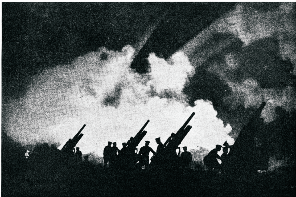
Moodsaid relvi — lennukid, kahurid ja helgiheitjad.