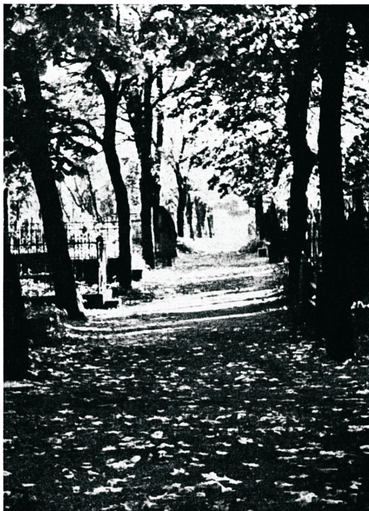
Siia on lõppenud paljude maine teekond...

Surmaga ei ole kõik lõppenud. Lunastatuile, kes on Issandas magama läinud, on auline ärka-