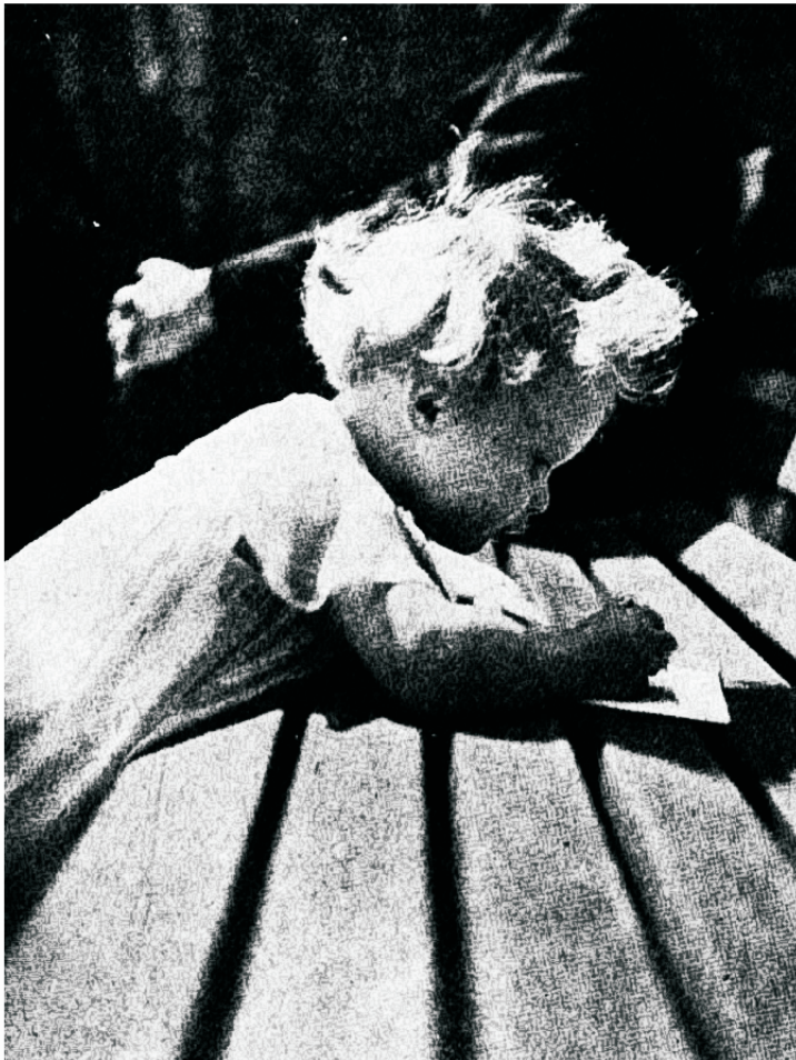
Mõtleb valmistada üllatuse...

Kõnelege alati üksteisest head. Viibige nende heade omaduste juures, kellega teil tuleb läbi käia, ja nähke nii vähe kui võimalik nende vigu ja puudusi. Kui teid kiusatakse kaebama selle üle, mida keegi on ütelnud või teinud, siis kiitke midagi selle isiku elus või iseloomus. Arendage tänulikku meelt. Täna Jumalat tema armastuse eest, et ta andis oma Poja surma meie eest. Ei tasu iialgi mõelda oma muredele. Jumal kutsub meid mõtlema tema armastusele,