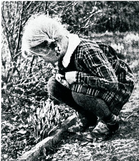
Nii imeline ja kaunis on loodus...

kujuks Jeesuse käitumine. Lapses tekib soov teha nii, nagu seda tegi Jeesus.