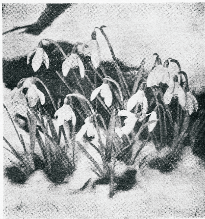
Lumekellukesed — esimesed, kes asunud looma kevadist ilu

Võib-olla uinub ka meie südames jumalik säde, mis ootab vaid kevade tuuli, et lõkkele lüüa leegitsevaks tuleks. Maailmas on vaja mehi, kes julgevad valida tõekspidamised, mis on ausad ja head, kes julgevad ütelda ei siis, kui kõik teised ütlevad ja; kes julgevad seista kehva ja mahajäetu eest, kui talle tehakse ülekohtu; kes julgevad olla halastajad ja heasüdamlikud, kui