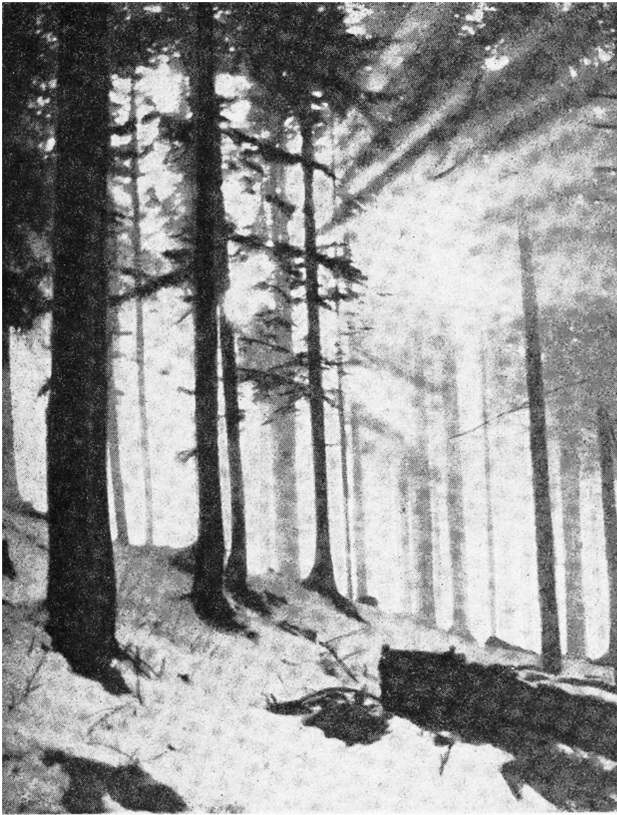
Märtsi päike on vabastamas loodust

teised on julmid. Maailmas on vaja isiksusi, kindlaid ja tugevaid.