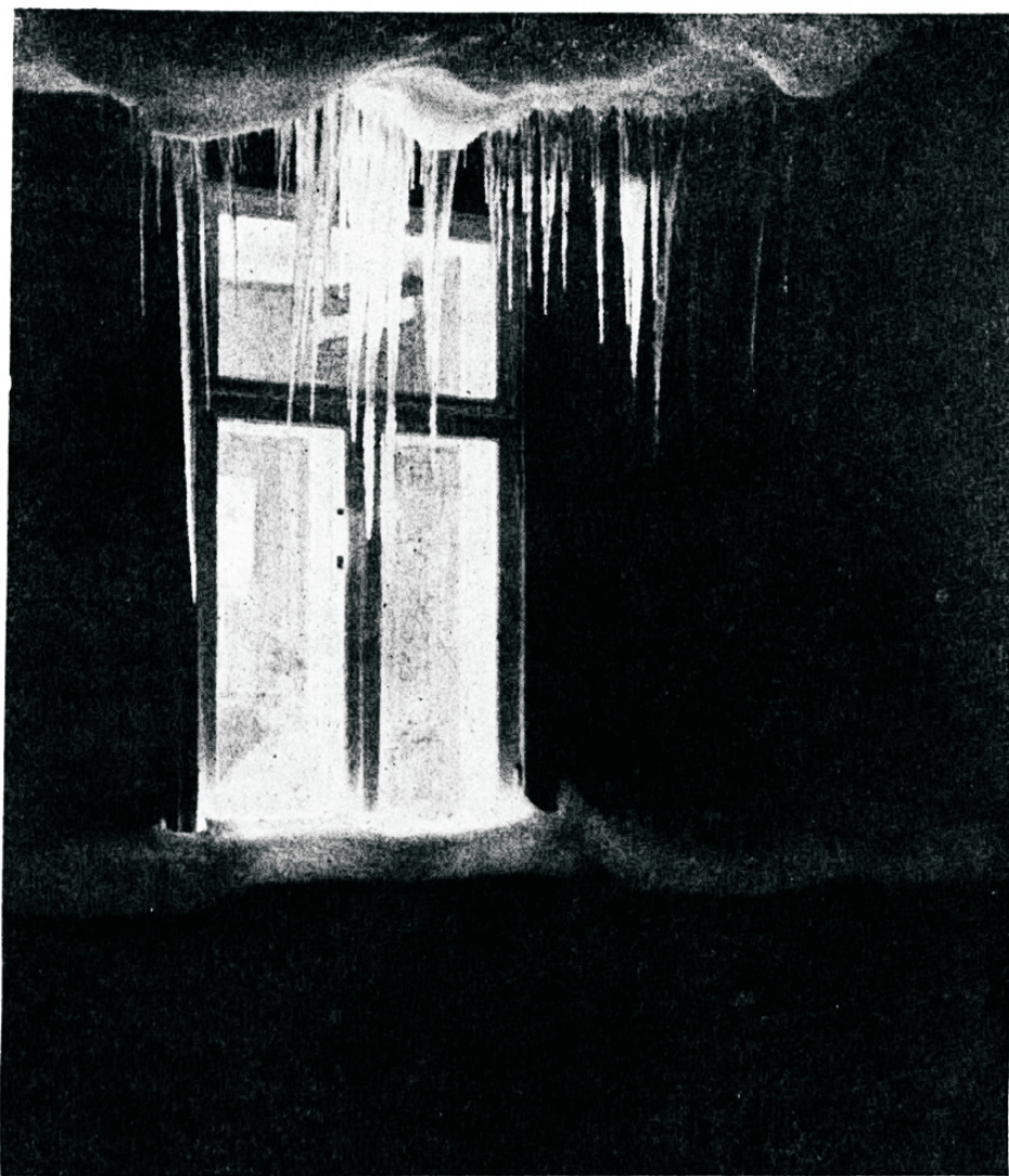
Võit pakase ja pimeduse üle