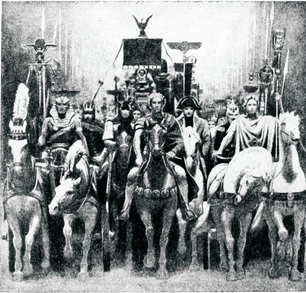
Need mehed on tahtnud maailma saada enese kätte. Vasakult — Ramses II, Attila, Hannibal, Caesar, Napoleon, Vilhelm II, Aleksander Suur.

bad olid osalt rauast, osalt savist. Edasi näidati unenäos, kuidas üks kivi langes ülalt alla kuju jalgele, mille tagajärjel savi, raud, vask, hõbe ja kuld puruks peksti ning tuulest ära kanti, nii et sellest ei jäänud midagi järele. Kivi ise aga, mis kuju purustas, muutus suureks mäeks ja täitis terve maailma. Taanieli seletuse põhjal tähendab see kuju maailma riikide pilti ja nende saatust. Taan. 2, 31—35.