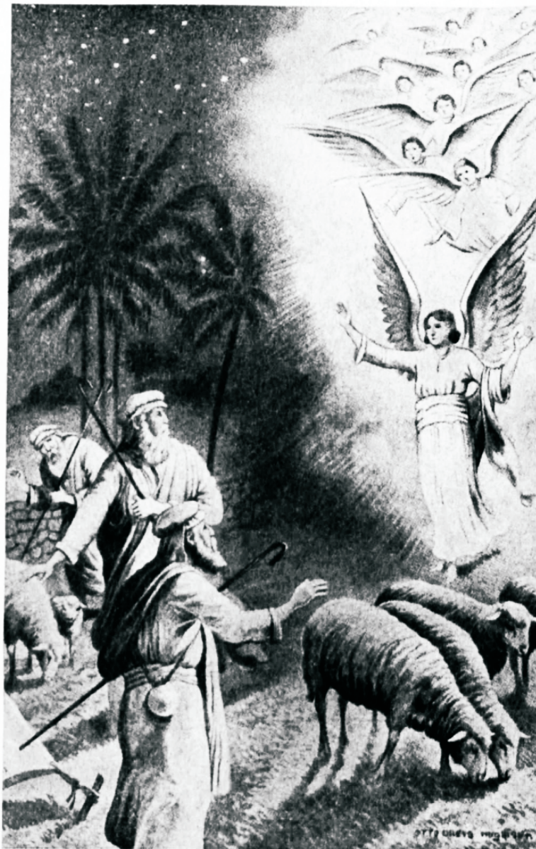
„Ja äkitselt oli inglīga taeva sõjaväe hulk, need kiitsid Jumalat ja ütlesid: Au olgu Jumalale kõrges, ja maa peal rahu, inimestest heameel.“

Juutide seas elasid veel selle pühitsetud suguharu järeltulijad, kes olid alal hoidnud Jumala tundmise ja kes kannatlikult ootasid isa-