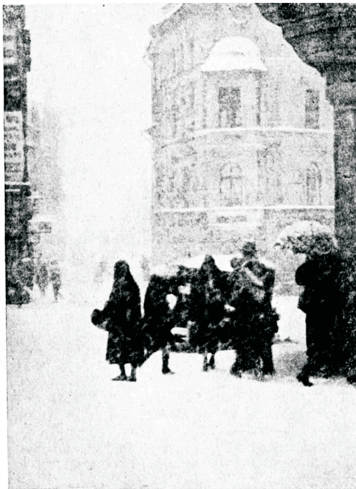
Toas olla on parem . . .