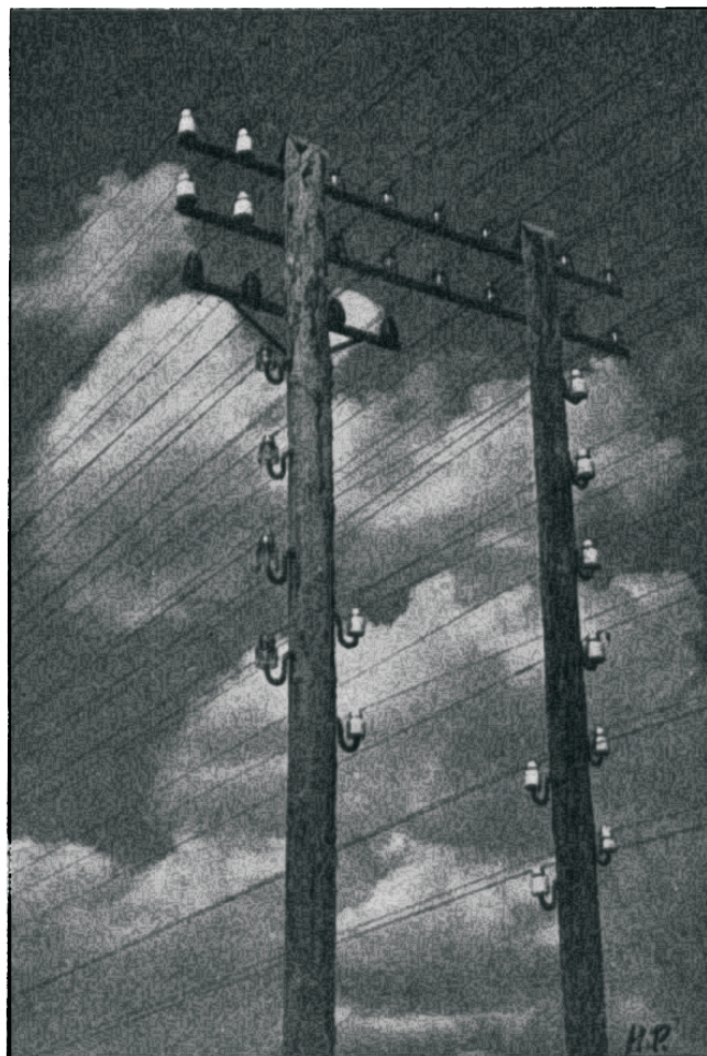
Kauguse mõiste on kadumas.

Kahjuks inimkond on veel liig kaugel ideaalset seisukorrast. Ei saa olla ühiskonda, kui igaüks elab üksnes iseenele, pidades igal sammul