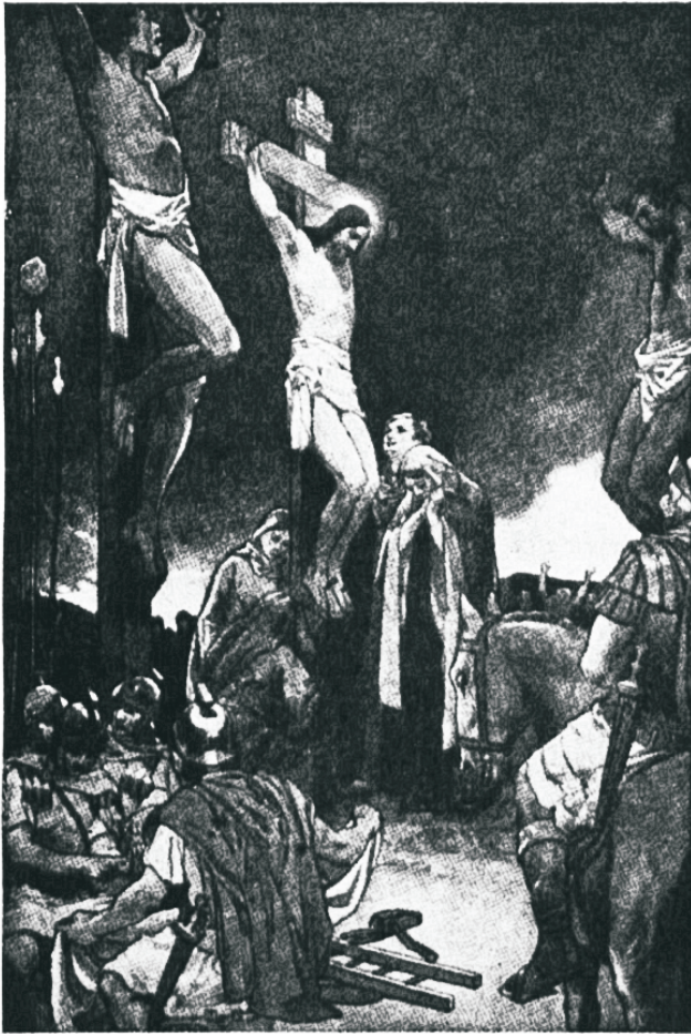
Ohver inimkonna eest