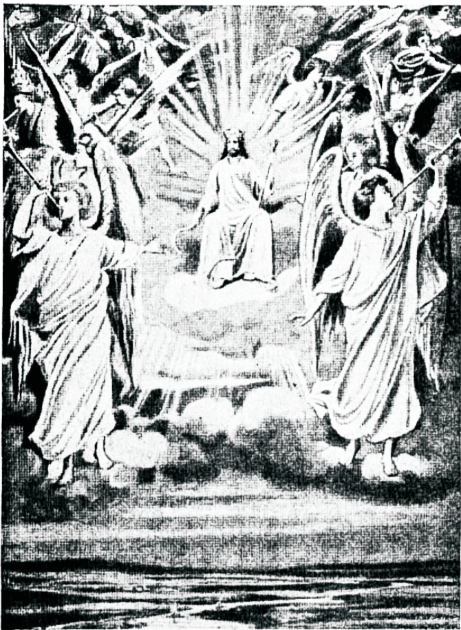
„Ja ma nägin, ja vaata, üks valge pilv, ja see, kes istus pilvel, oli Inimesepoja sarnane, ja temal oli kuldkroon peas ja terav sirp käes...“ Johannes. (Ilm. 14.)

16.: „Seitsmenda kuu kümnendal päeval.“ Kümme päeva enne seda anti kogudusele pasunate helil teada, et äralepitamisepäev ligineb, ja kutsuti rahvast ettevalmistusele. Äralepitamisepäeval ülempreester läks kõige pühamasse paika.