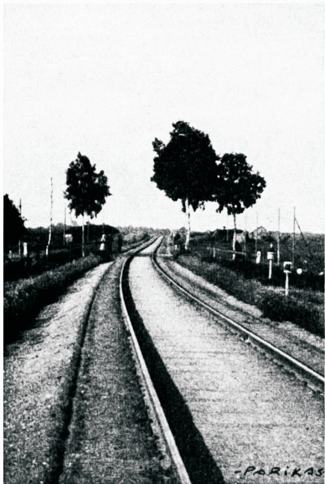
— Oteks võimalik arendada täielist koostööd inimkonnas...