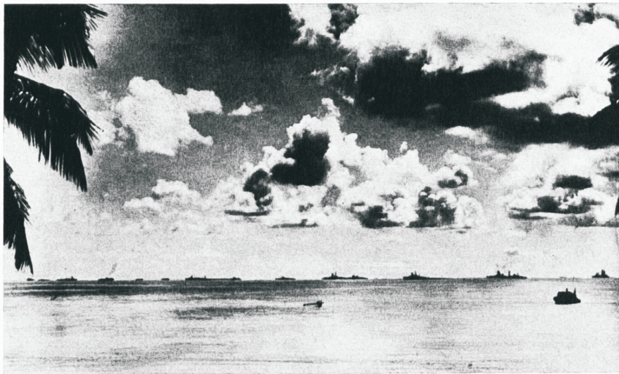
Jaapan püüab näidata, et temale kuulub õigus olla Aasia peremees...

Suurem põhjus Jaapani ekspansioonitungis peitub siiski aga jaapanlase hingeelus. Jaapanlane on kasvatatud sõjamehelikuks, vähenõudli-