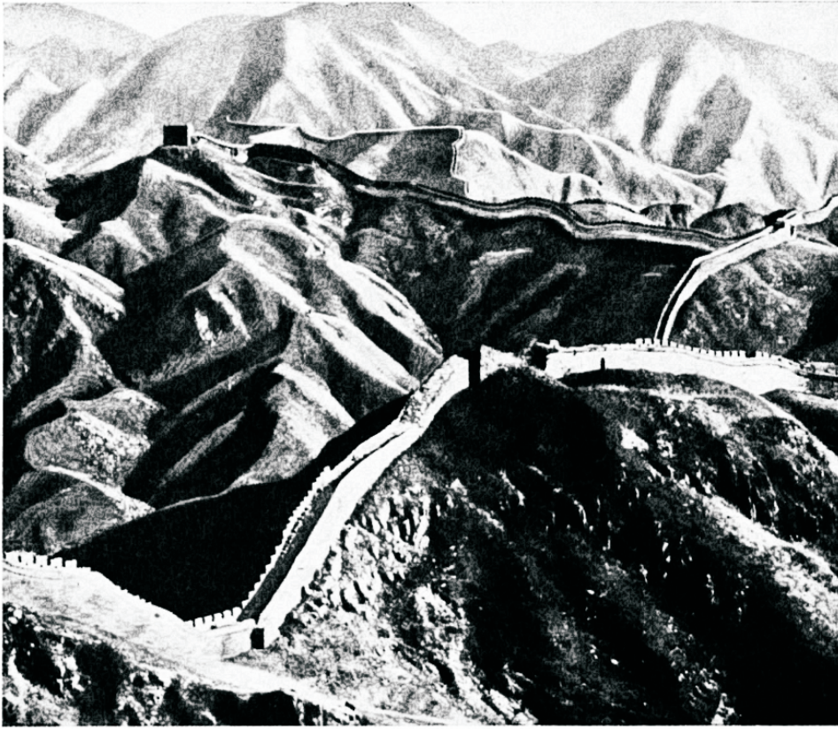
Hiina rahvas on ehitanud müüri oma maale ümber ja nii on saanud kaitstud saagihimuliste naabrite eest. Tema muistseid vägivaldseid naabreid ei ole nüüd enam...

kuks ja edasipüüdjaks. Enne 1905. a. Vene-Jaapani sõda ei teadnud paljud veel Jaapanist. Kuid siis korraga kerkis esile see maa ja astus määratu kiirusega juhtivate riikide esirinda. Väike mongoolitõugu jaapanlane püüdis sitkusega edasi. Hiina on minevikus olnud rahuarmastaja kultuurmaa, kuna Jaapanis on valitsenud sõjakas vaim. Hiinas on olnud kümneid valitseja-suguharude vahetusi ja sisemisi kindralitevahelisi võitlusi. Jaapanis on aga peagu kogu tema ajaloo kestel valitsenud üks dünastia. Mikaadot nimetatakse päikesejumalanna pojaks. Tal on piiramatut veto-õigust kõigile seadustele ja teda austatakse ka nagu jumalat inimeste keskel.