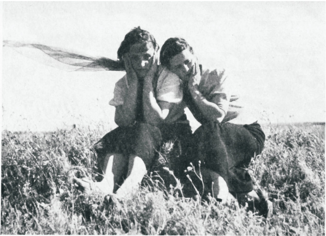
Päikeses ja tuules

siis oleks asi palju halvem. Eriti noorsugu, kes on tähelepanelik, uudishimulik ja kõigiti vastuvõtlik, on hädaohus kaotada oma tasakaal ja anduda mitmesugustele laostavalt mõjuvale tegevusele ja eluviisidele. Silm näeb ja kõrv kuulab kõikjal asju, mis rikuvad noorte kujutelmad, mõttemaailma ja tunded. Pingulolek, tervisevastane eluviis, valetoitlus ja närvlikkus aitavad edendada madalamaid kirgi ja nõrgestavad püüdeid kõrgema ja ideaalsema järele. Vastupanujõud pahedele lõdveneb ja kaob lõpuks täielikult. Juba varakult kuulevad lapsed kõlvatuid sõnu ja näevad alatuid tegusid. Umbruskond mürgitab peagi nende tundeliku ja puhta hingeelu ja nad asuvad keelatud teele. Tihti vanemad ei teagi missuguses hädaohus on nende lapsed, ja kui avastatakse tõeline seisukord, on juba hilja appi tulla. Mitmed lastevanemad ei näi ise mõistvat nende lapsi varitsevaid kohutavaid hädaohte; nad alahindavad nende kahjulikkust. Meelelised lõbustused on sedavõrd suureks kiusatuseks noortele ja ka vanadele, et neile ei suudeta vastu panna. Isegi on küllalt neid, kes ülistavad ülekohtu ja kõlblusetust.