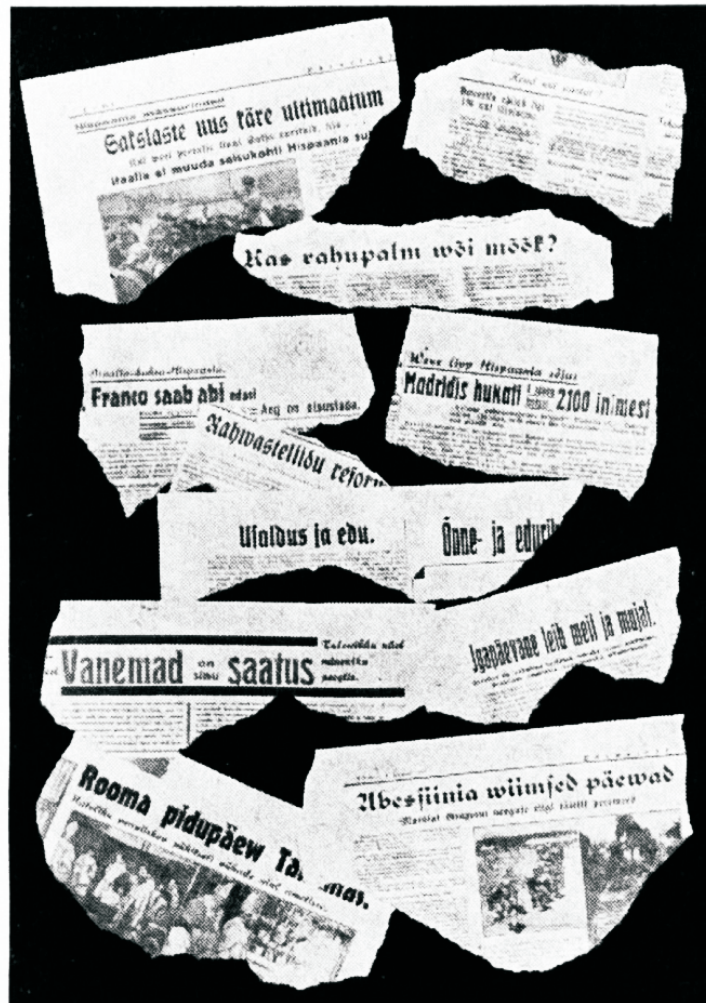
Te saate kuulda sõdadest ja juttusid sõjast, ennustas Kristus.

Tegelikult on tehtud mitmel korral tühistada jumalikku teadaannet. Vahetevahele on olnud riike ja valitsejaid, kes püüdsid koondada Lääne-Euroopat ühe võimu alla ja luua üht suurt riiki. Nii võime mainida Karl Suurt, Napoleoni, Karl V-dat ja meie päevil mõnda riiki, kes on soovinud panna maksma oma hegemooniat teiste üle. Nende üritused olid aga määratud ebaõnnestumisele, „sest nad ei jää mitte teine teise külge, otsekui raud ei anna ennast segada sauega.“ Taan. 2, 43. (Lõpp viimasel küljel.)