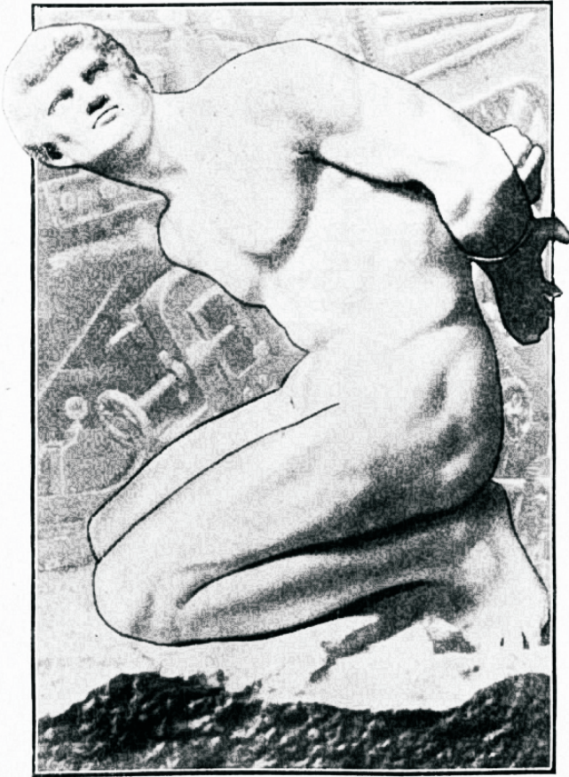
Masin on orjastanud inimese...

sed tuhanded ja miljonid elavad puuduses. Iga rikka vari on piiratud sadandete ja tuhandete kehvade inimeste varjudest. Kaupluste waateaknaile on kuhjatud riideid ja toiduaineid, kuid waejemad peawad leppima waid nende waatlemisega. Laod on täis igasugust wara, kuid paljude kehvade korteris puuduwad tarwilisemadki asjad.