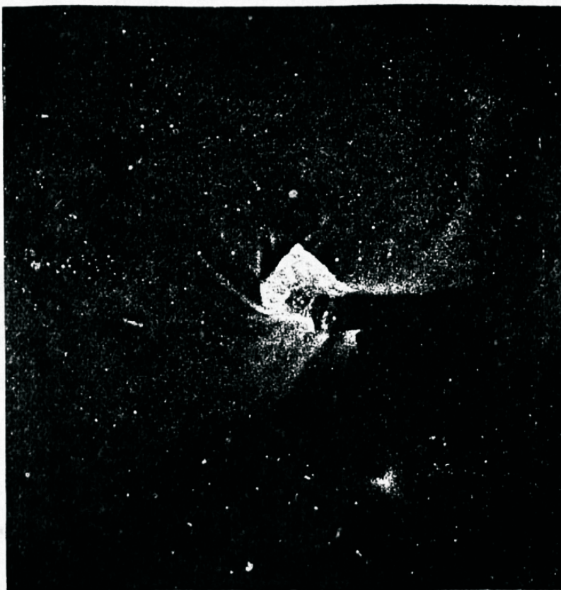
Udukogu Trapetsi tähtedega Orioni tähekogus.

Toome siinkohal ära ka joonise tähistaevast, nagu see on käesoleva j. o. detsembrikuu kesk-