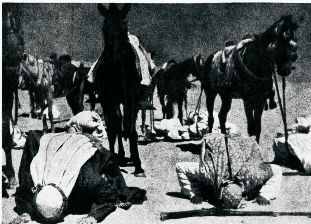
Araablased-muhameedla- sed kõrves palvetamas