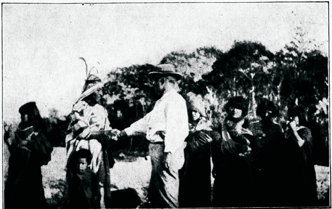
Indiaanlaste pealik võtab vastu misjonäri

Loomupärane arustus nende algeliste inimeste juures on inestatav. Nad aimavad ilmanuust eite juurema tähtsusega kui meie meteoroloogid. Indiaanlased Vancouveri jaarelt teavad täpselt, millal peab lahkuma merelt, et õigel ajal jõuda kaldale — enne kui tõuseb torm. Meresõitjad selles kohas jäävad tihti hättä. Indiaanlane aga tabab õige filmipilgu. Algeline inimene omab ka osavuse pikaks reisiks. Indiaanlased Saint Lawrence' jõe piirkon-