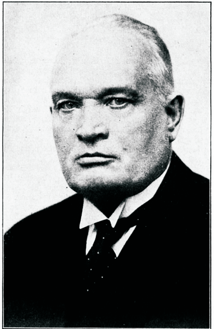
Riigivanem K. PÄTS

Inimeste wäärtus oleneb palju sellest, kas ta on suur või ta tahab olla suur. Ühed on tõeliseid suureid, sest neis on suuruse absoluutne wäärtus, kuid teised tahavad olla suureid teiste inimeste ku- lul või piinavad selleks saada kõrvaliste abinõude waral. Nende auahmis tahab, et neid tunnusta- takse ja imestataks, ilma et nad ise kiitaksid, kas nende teotsemine on inimkonnale kasuks või kah- jus. Nende uhkus põlgab ning alahindab teisi ja piinab oma intellektit läbi suruda. Teiste tõelised wäärtused ei leia nende poolt tunnusta- mist. Kus neil oleks korwis teiste tegu hinnata tunnustawalt, seal nad koguni wäljendawad sõnu, millega wähenad teiste wäärtust. Nad ei taha lasta tulla esile teiste waateid, mõtteid ning aru- saamisi, vaid piinavad nende wäärtust pilkawalt alandada, et selle juures ise enam hiilgada sellega, mis nemad on mõelnud, tahtnud, ütelnud ja teinud. Alati nad seavad oma mina esipla- nile, kartes, et neid muudu ei panda tähele või isegi wõidakse unustada. Säärastelt tegutsew ini- mene kirjub maha oma wäärtuse ning oma ülalpi- damisega ta ei lasse ka teistes areneda wäärtusi.