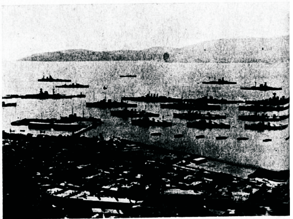
Inglise sõjalaewastik Gibraltar

See enmustus tõdenes, kuigi jee tundus wõit jõngritele tol ajal imelikuna. Rooma riigis, kus ristiusš ajas oma esimejed juured, mõllajid alatised jõjad, kuni jee riik häwitati ja määrati kadumisele rahwaste rändamise ajal. Määrimata muhamediujuliste jõjsetungi Euroopasse, werised riid ja jõjad ei lakka ka kriitlikkude riikide wabel. Keskajal on tuntud jelle poolest, et siis jõdisid wajallid isefestis ja oma isandatega, jamuti riigid üksteisega. Eriti juured ja laiaulatuslikud olid Napoleoni jõjad. Sellest ajast alates — 19. sajandist — on rahwaste ja riikide werine kurbmäng eriti kohutaw.