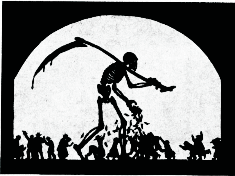
Päevauudised . . . Surmal on rohke lõikus

Narkootilised ained on tuntud jiidametunnistuse hääle waigistajana ja furjadele teedele juhatajana. Need nõrgendavad otjustamis- ja mõttevõime, riisuvad enesevalitsemisvõime ja alandavad looma tasemele inimese, kes kord oli loodud Jumala näo järel.