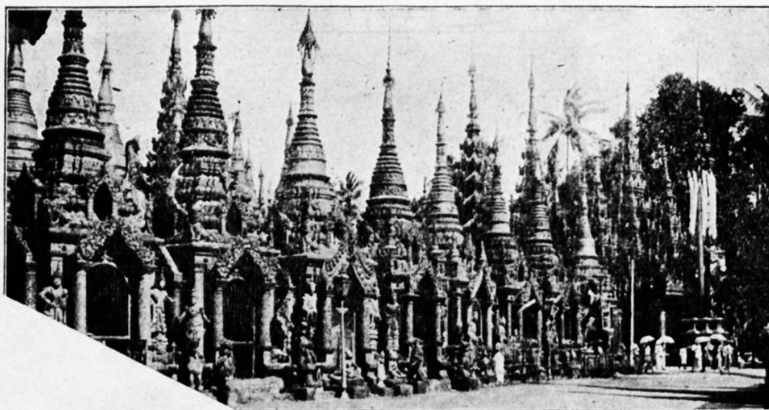
Indias on palju toredaid templeid, Pildil — buddha-tempel, mis asub Rangunis.

Brahmanates leiame tagasiminekut lihtjast Rig-Weeda usundist. Seal esineb ebauju mõttetatus. On kujutatud pimedat müstikat ja preestrite üleskut, mis on haletſuswäärne.