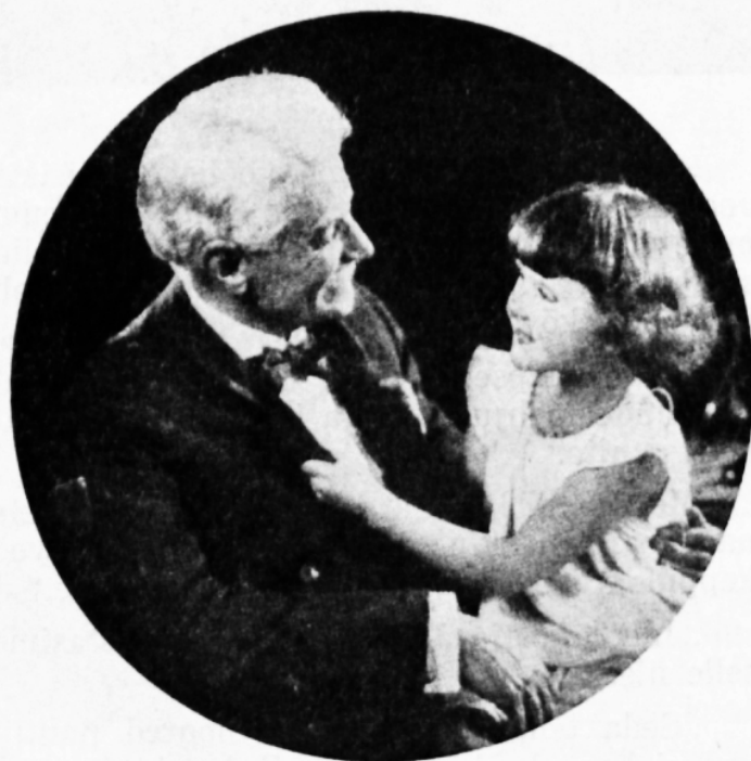
Vanaisa on alati lahke ning sõbralik . . .

Kui ilus oleks maailm, kui kõik lapsed oleksid nii heasüdamlikud ja armastusrikkad, et Jumala aupaiste võiks paista nende nägudest.