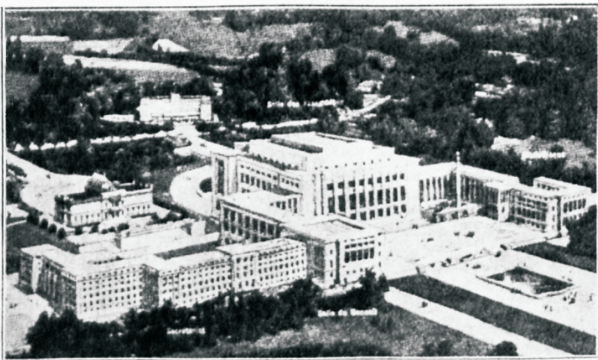
Rahvasteliidu uus palee Genfis, mis kehasab praegust rahupüüet.

Lugesdes jeda prohvetikuulutust tõuseb küsimus, mis tähendab sügavus, kus saatan teotakse.