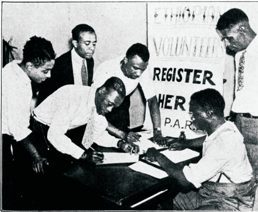
New-Yorgi neegrid annavad end üles Abessiinia väkke.

Seepärast iskawadki eurooplased ja eriti just itaallased Abessiinia endale. Seega on abessiinlastele nende kodumaa õnnistus ühtlasi ka õnnetuseks, ahwatledes pealetungile kadunud naabrid.