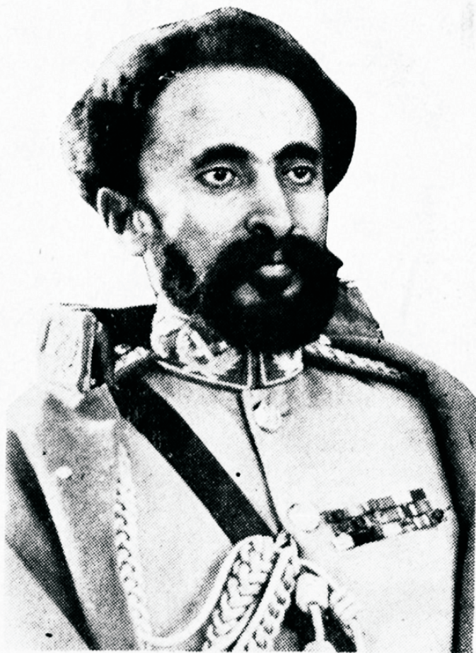
Abessiinia keiser Haile Sellasie.

Kuidas kujuneb maailma jaatus, jeda ei tea inimene ette arwata, nagu näib, et inimene ei jõua ka jõjatuuli kinni pidada. Ei ole aga kaheldaw, et elame prohwetlikult tähtjal ajastul. Makjab proh- wetifõna: „Ärge tehke paha ei maale, ei merele ega puudele jeni, kui me oma Jumala julaste otjaefife jaame pitjeriga märkinud“.