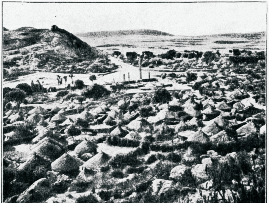
Aksumi linn Abessiinias.