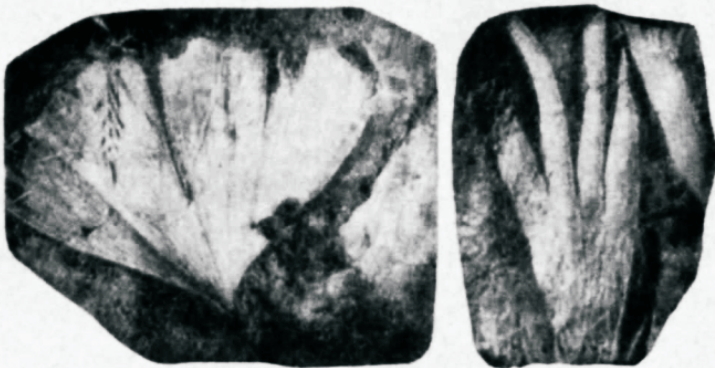
PALMILEHE KIVISTISED. Need troopiliste taimeae kivistised on leitud põhjavöös asuvas Alaskas.

Weel tänini on selgitamata küsimus, millal ja millistes oludes on tekkinud need hiiglaulatusega lademed, eriti Kalifornias, Kanjas ja Inglise maal, kui arvestada ainult määratu mulla, savi ja liiva hulga, mida need sisaldavad. Tumm aine ise ei suuda vastata küsimustele — millal ja kuidas?