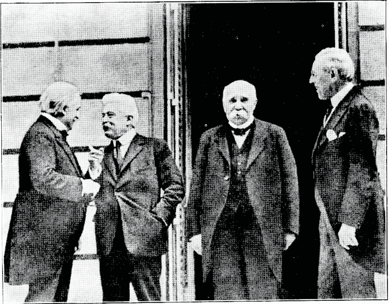
Neli tähtsat rahvameest. Vasemalt paremale: Lloyd George (Inglismaa), Orlando (Itaalia), Clemenceau (Prantsusmaa), Wilson (Ameerika).

del prohvetlik jona, mida leiame vanas, tuttavas raamatus — piiblis. Sääal on kirjeldatud kõik tähtsamad sündmused inimajaloos ja ühtlasi ka näidatud pääsetee neist raskustest ja segadustest.