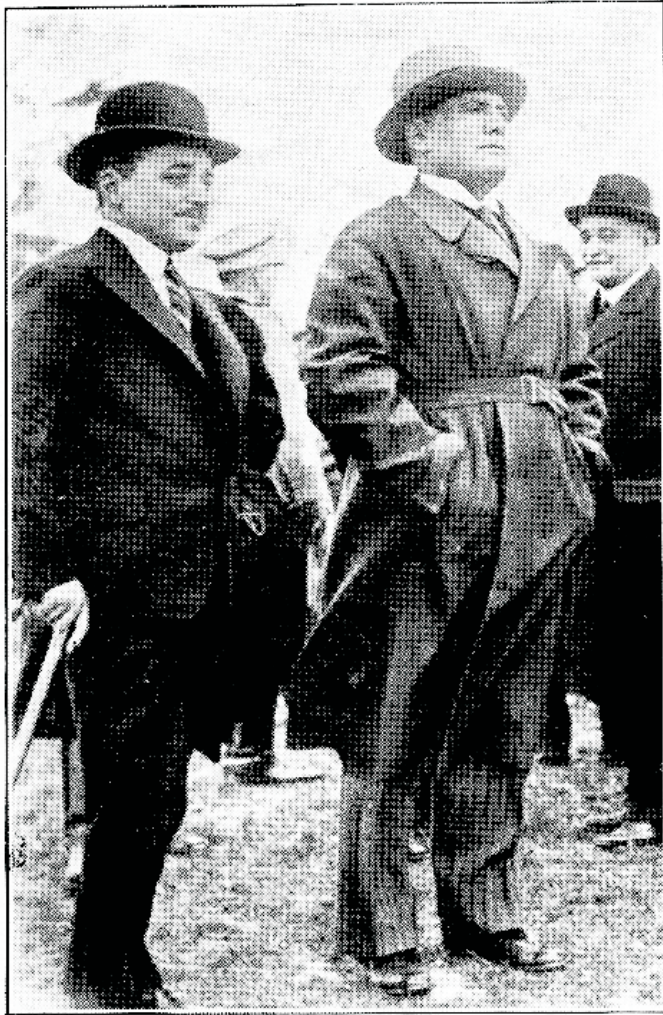
Diktator Mussolini ja Austria riigitantoler Dr. Dollfuß Roomas.

Meesugustes dramaatilistes olufordades, kui hirmul maailm kannatas hitlerlaste rünnaku all, kui „Saapani kolonnid koondusid mitme Hiina ajaloolise linna ründamiseks ja kui Boliivia ja Paraguay asusid tegelikule sõjajalale“, president Roosevelti jaatis üleskutse viiekümnenelja rahvale, nende seas ka Nõukogude-Benele. Ta ütles: „Moodsad