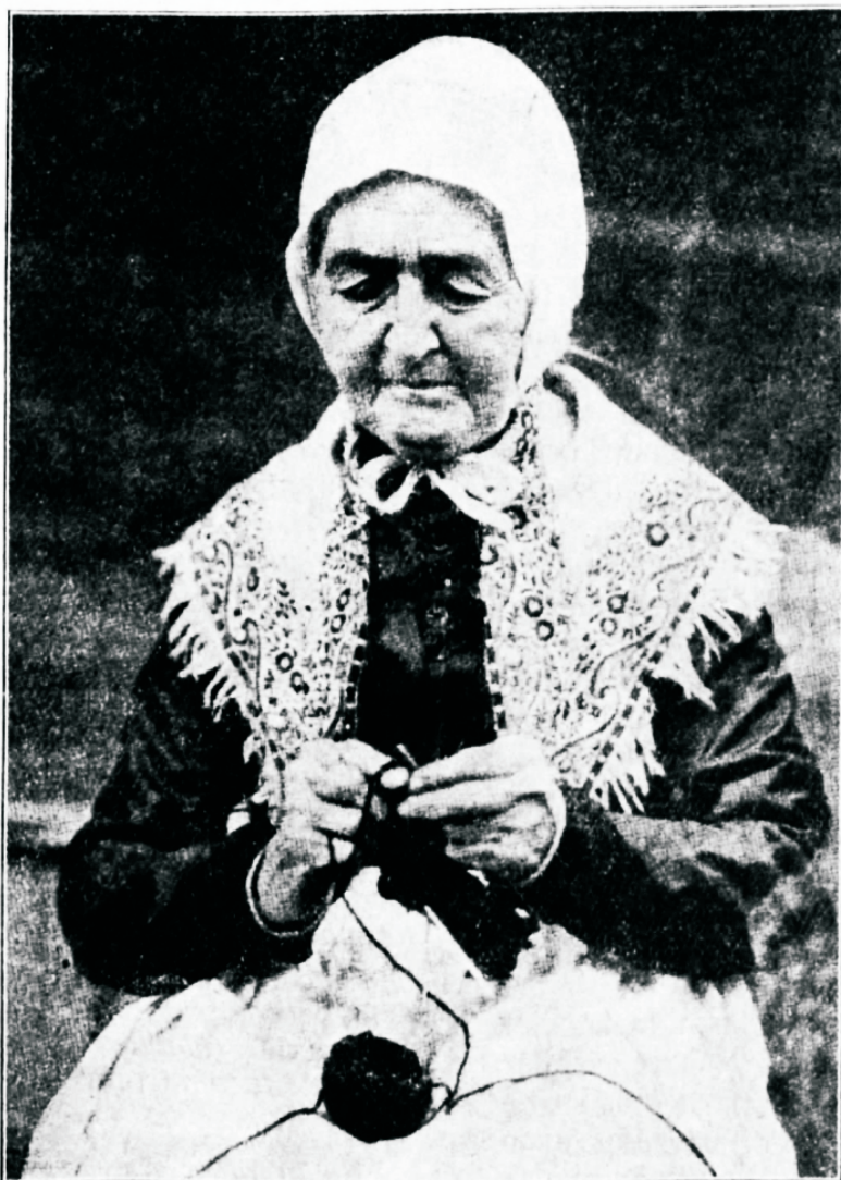
„Lusta oma isa ja ema, see on esimene käsufõna töotuiega.“ Paulus.

Nii mõnigi ema keelab aja- ja järelemõtlemise puudusel oma lastele omawahelisi ilmfiituid lõbustusi, kuna tema wirgad sõrmed ja wäsinud jilmad mõne ilueseme walmistamise juures tegutse-