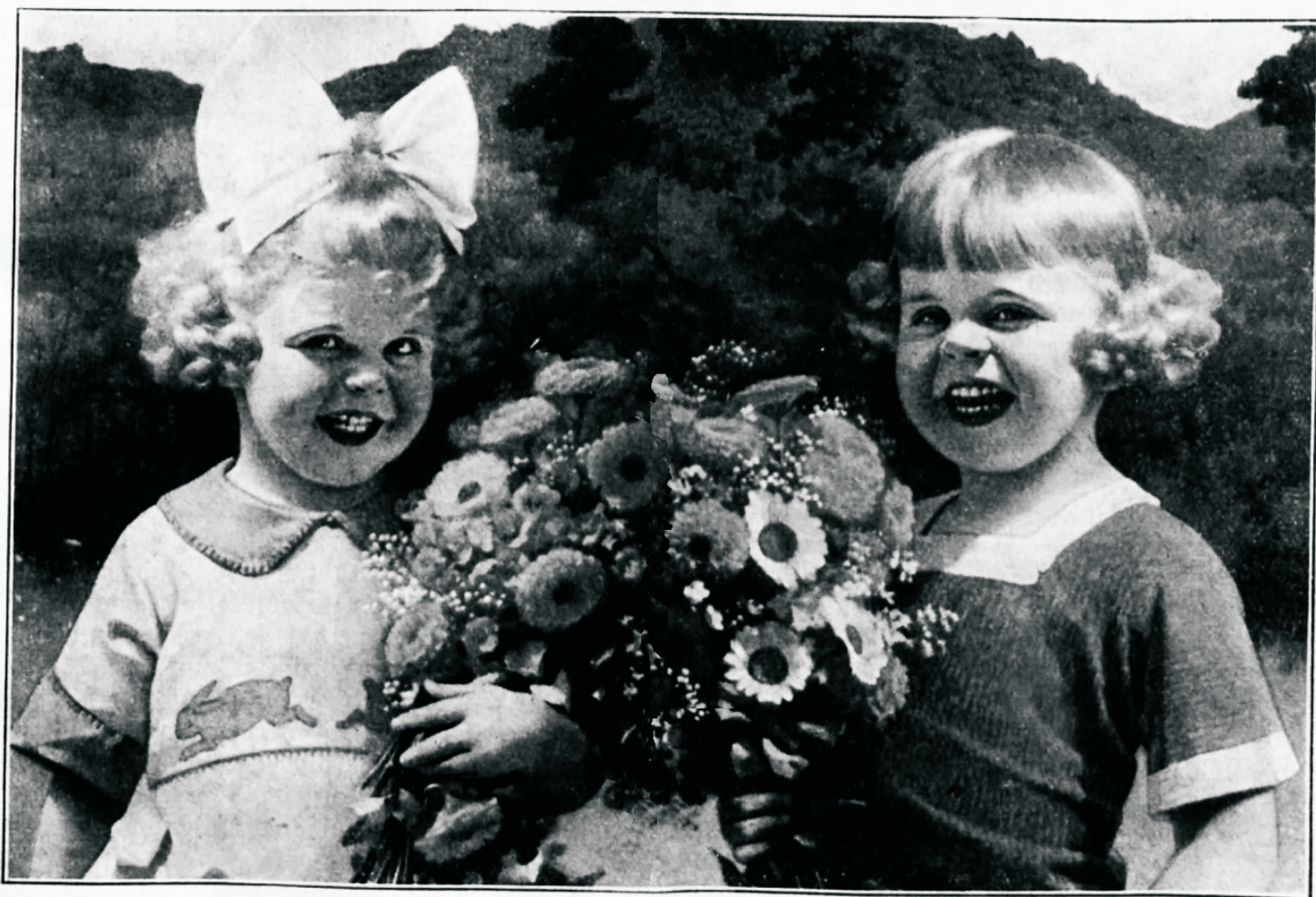
Siili heale emale tema aupäewaks.

likena. Et ta wajab foolitatud wainuwõudu, ei wõi tema raamatukogu koosneda ainult piiblist ja kokaraamatust. Tema tegewusele, olguigi koduist laadi, kuulub enam tähelepanu, kui meie harilikult