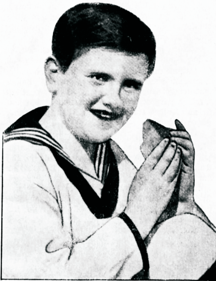
Hooisalt näritud leib seedib hästi ja annab jõudu.

See leotatud, wähe näritud leib on leib, mis saatuslikult on eemaldatud ühest tähtsamast osast üldisest seedimisprotsessist — sülgjega läbiimbutamisest.