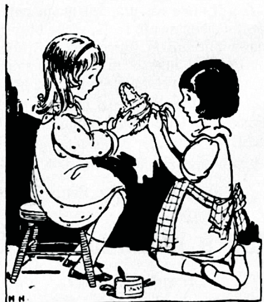
Rutt ja Lillu üllatusi walmistamas.