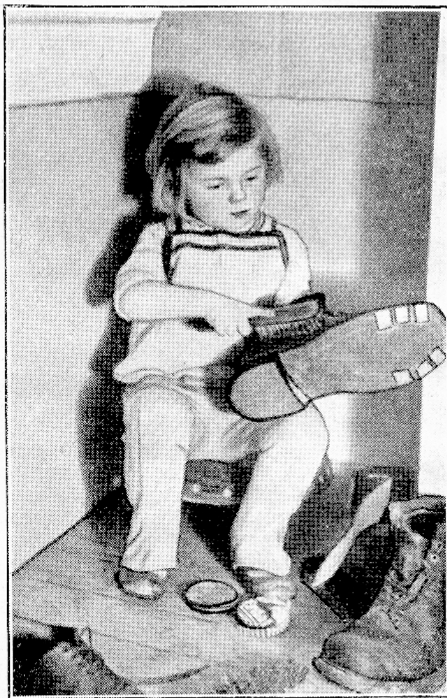
See tahtmise juures teostatakse fuuri asju.

Te armastate lugeda, kuis wanasti rännati kaugele teise kohta või purjetati kaugele jaarele, kus polnud weel elanud ükski inimhing. Nad pidid ise