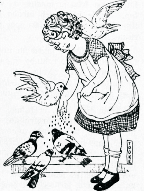
Suurima rahuldustunde annab hoolekanne teiste eest.

Aga mitte kõigil eluoluwustel pole nii hea. Mõtlemis waestele lindudele. Pole neil jooje rii- deid. Neil jeesama julgede wari ihu peal, mis juwelgi. Pole neil kuhugi minna, po- le neil kuski jooja paika. Igal pool on külm ja lumine. Puumokjad on här- mas ja jääs. Win- ge tuule käes ofjad kõlijewad kui jõed. On põletaw külm. Lind waenefe hüü- pab ofjalt ofjale, et teha jooja. Pi- gistab ifka oma tiibu kofku ja hõõ- rub warbaid. Küü- ned külmetawad ja warbad waluta- wad. Jõõsi ei saa jääda tuffumagi. Küilm tahab wä- gisi wõtta hinge. Nad kõik on wait. Kurb on aeg.