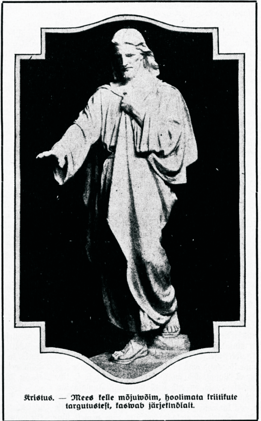
Kristus. — Mees talle mõjutõim, hoolimata kriitikute targutustest, fastwab järjekindlalt.

Kuigi kriitika püüab kõik teha, et oma wäidet ewangeeliumide mitteajaloolisuses maksuuses hoida, kuna ta püüab tõendada, et ewangeeliumid ei ole kirjutatud nägijatekt, ometi on ta nõus Pauluse kirjadega. „Suur enamus teoloogid tunnustab ehhteks wähemalt nelja, nimelt Kalatia, kahte Korintuse ja Rooma raamatut,“ (prof. dr. Drews). Ükski