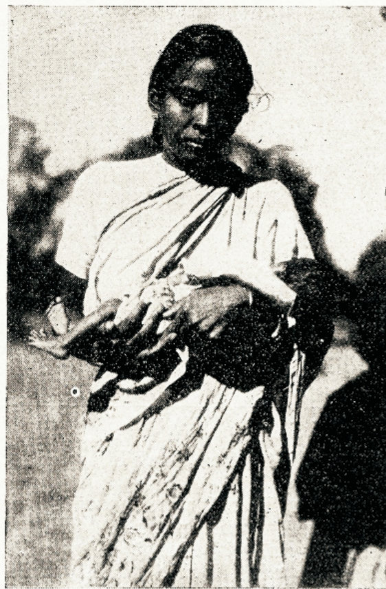
Naine lapsega ootab misjonihäigla ees arstilist abi.