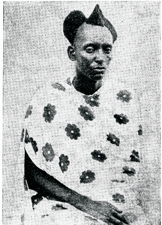
Üks kristlik päälif Ruandas, Keff-Asfritas.