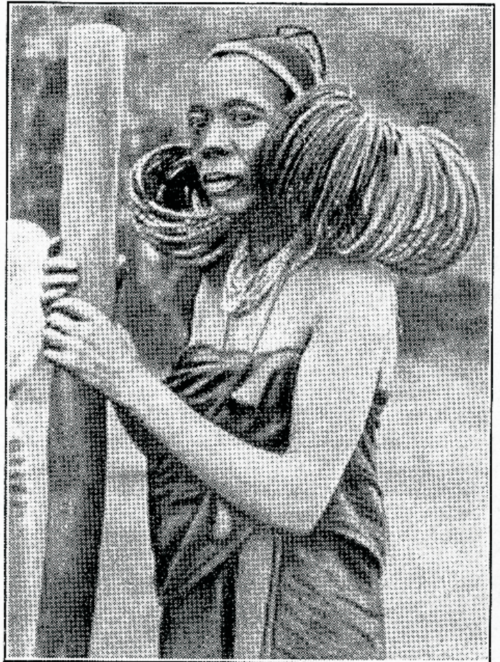
India noorik, kes kannab fummasi tõrwas 150 tõrwarõngast.

See seisukord on ette nähtud Jumala prohweiteist. Nii ennustas Iesaja: „Waata, Sehoowa wõtab maa tühjendada ja seda footumaks ümber lüüa ja pöörab maapäälsed kohad ümber, pillab laiali neid, kes säääl elawad. Ja rahwas peab olema nõnda kui preester, sulane nõnda kui tema isand, tildruk nõnda kui tema emand; kes ostab, nõnda kui see, kes müüb; kes laenab, nõnda kui see, kes laenuks wõtab.“ (Ies. 24, 1—2.). Apostel Jakobus kirjeldab rikaste õnnetusest wiimseil päewil.