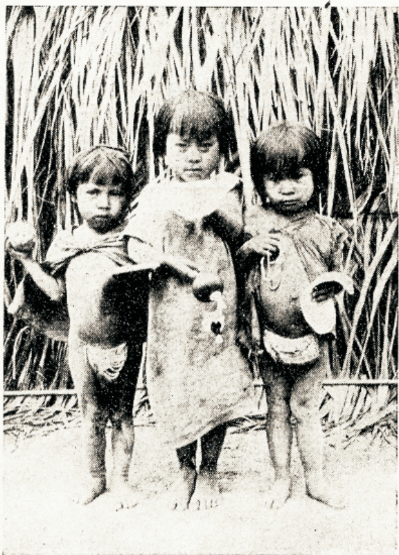
Indiaanlaste lapsed Lõuna-Ameerikas, kes annetamise läbi misjonifooli heats väljendavad oma tänu Teesufele.