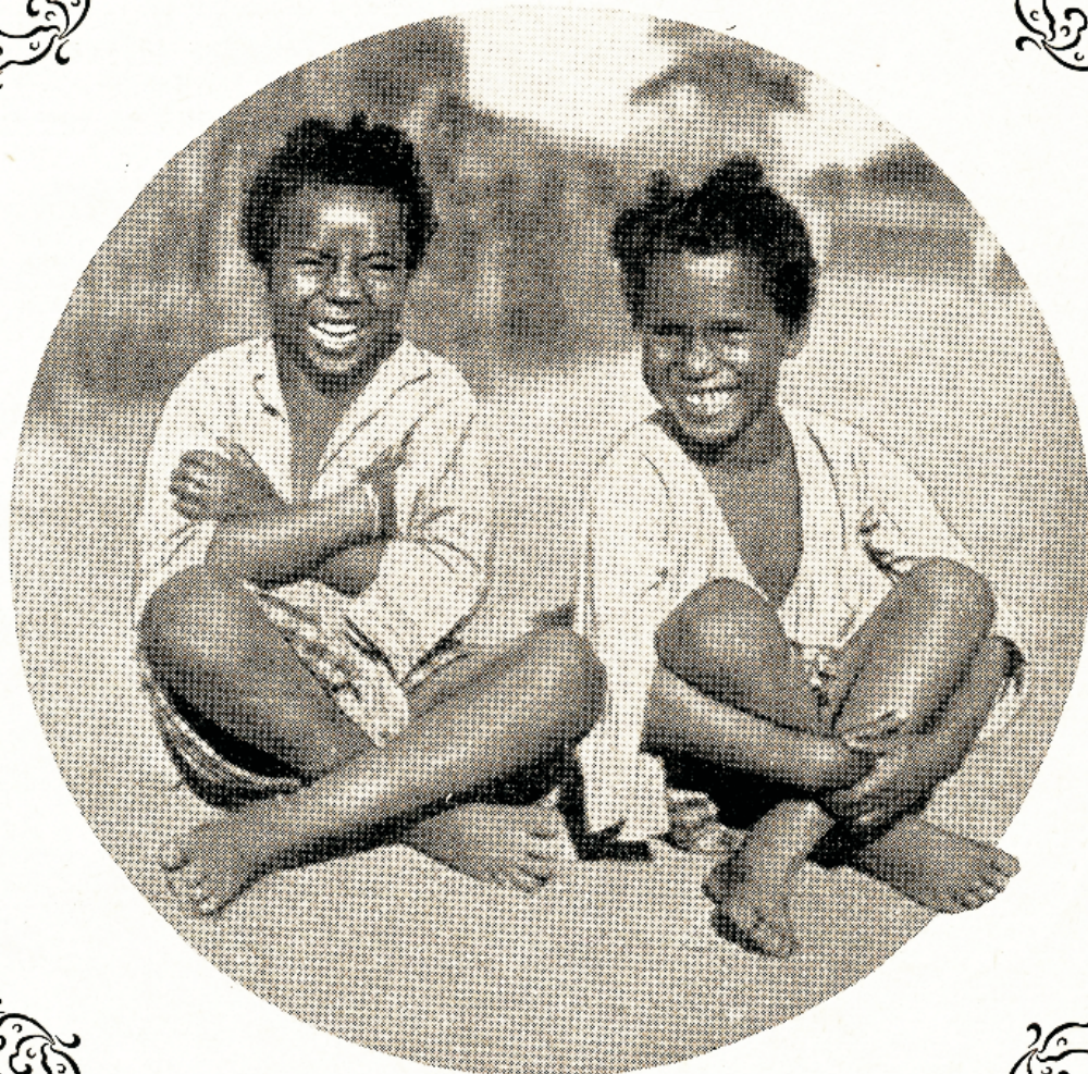
Ewangeliumi läbi ümbermuudetud mustad, tesse näod õnnelikkusest järeivad.

Arvatavad maagilised omadused saavad ise- äraliste toimingute läbi kõvendatud, näiteks kätemaksja sõrmeküüne alla peidetud nõiarohi