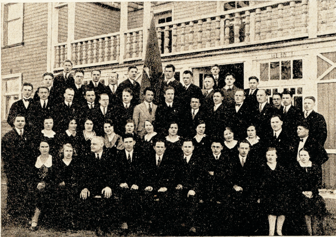
Walmis teenimijeks ja endaohtwerdamijeks. Balti misjonifeminari õpilased 1932/33. õppeaastal.

Peale selle kui kristlane on olnud õnnistuseks oma ümbruskonnale, kuulub temale ewangeeliumi wiimine ka kõigile neile, kes on veel paganlikus pimeduses ja eksõpetuses. See ülesanne kuulub igale kristlasele ja sellest ei wabasta meid mingi ettekääne ega wõimus terwes maailmas, sest seda kohustust pole meile inimesed asetanud, waid Õnnistegija ise. Mustadele ewangeeliumi wiimine on üks kristliku elu pea-