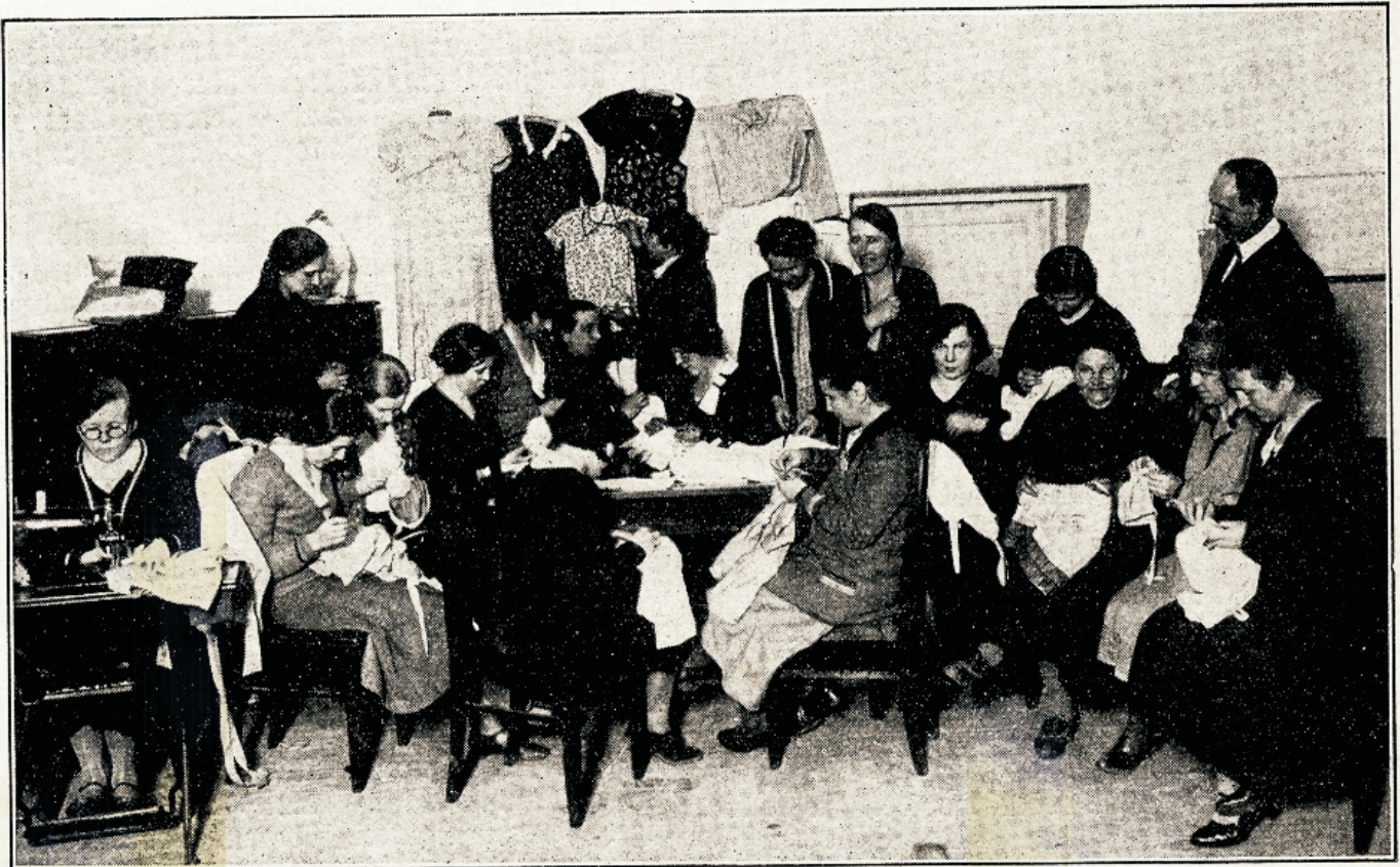
Meie häätegetwa organisatsioonil Tallinna osafonna liikmed käsitööil

näha mingisugune tume täpp. Seifatatakse ja oodatakse. Kogu läheneb; temas tuntakse wähe aja järele ratsanikku. Tal on kaasas natuke wett, mida jagatakse neile, kes kõige rohkem kannatawad. Nüüd asub ta karawaani etteotja, et neid juhtida teises suunas oasi juure, kust janunejad wõiksid saada wett. Ta ise kannatab nüüd ühes teistega, sest wiimane weetilk on teiste wahel ära jagatud. Järgnewal päewal nad jõuawad kohale. Wärske, karastaw wesi