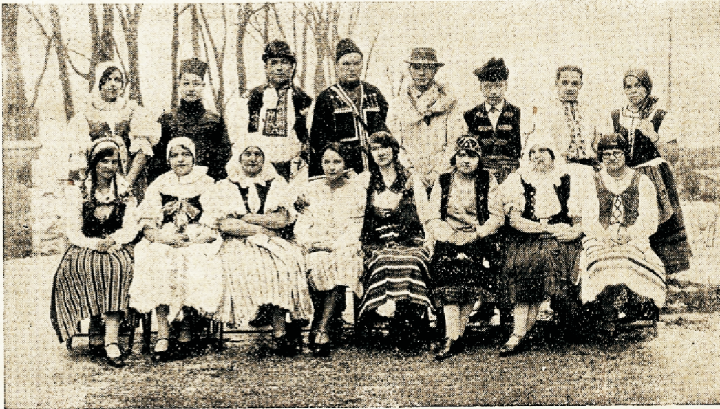
Meie Broadviewi kolledži rahwuswaheline õpilaste grupp rahwusliitus riietuses.

See on, mida wõib panna tähele juba ül- dise waatlemise juures, aga kui läheme rah- wa sekka ja külastame waesemaid perekondi, siis näeme, et puudus, wiletsus, kurbus ja walu