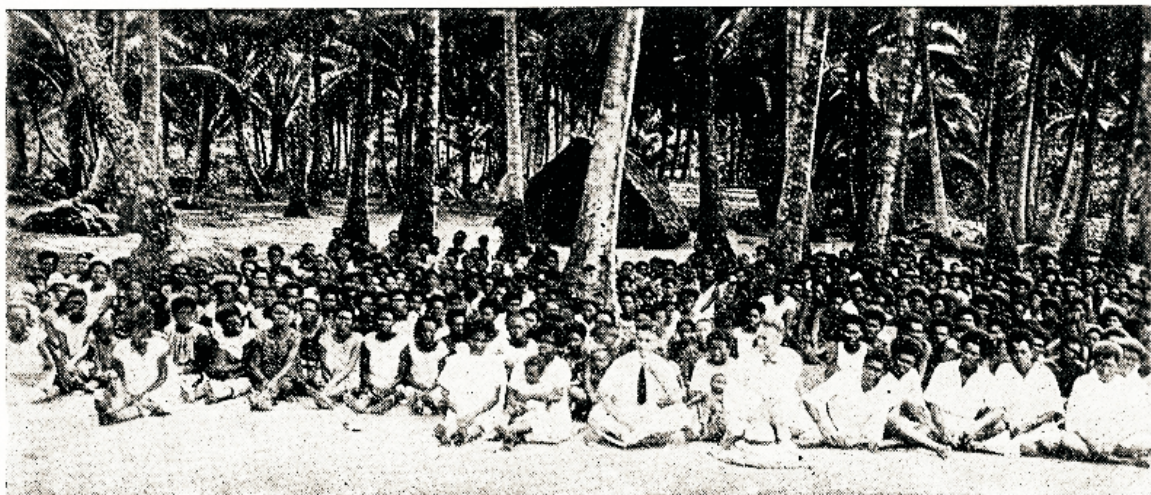
Pagan-ristlastest koosnew kogudus Uue-Guinea saarel.

magas öösel hästi, tunneb endal juba parema olevat, aga ainult pää kõvasti walutab. Me läksime teda vaatama. Leidfime wanad hitti ees küürutamas, aga seekord näisid nende näod weel süngemad olevat. Oma üllatuseks me ei leidnud haiget hitti. Meie küsimised kohtasid ainult trotslikku waikimist. Meil tekkis paha aimdus. Ruttu läksime hitti taha. Ja sää! leidfime otfitawa, aga millises seisukorras! Werine ja surmakrampides. Sügawad löikehaawad päänahal ja kaelal, käe tuiksooned läbi löigatud. Kõik abi oli asjata. Ta oli kaotanud juba liig palju werd.