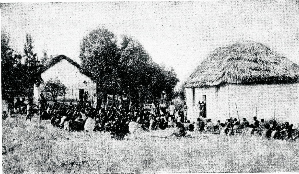
Arsti tulekut ootamas. Rahwahull misjonihai gla ees, Buandis, Kesk-Aafrikas.

Nii teeme oma tööd paganamaal. Me tunneme endid kinnitatuna, teades, et kogudused kodumaal meie eest palvetavad. Täewane Isa