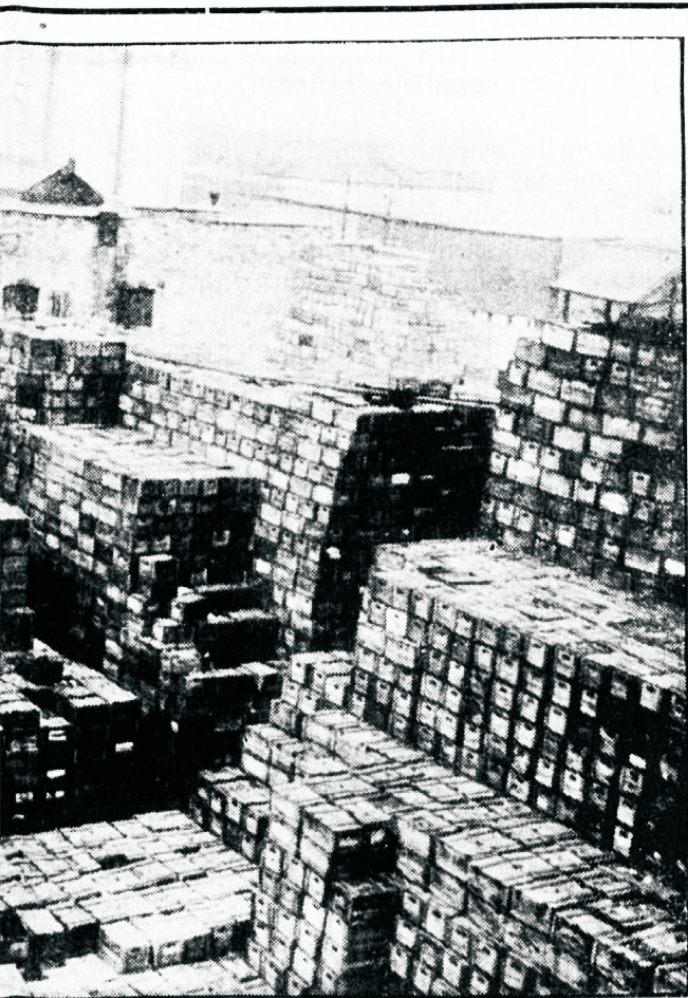
Ameerikas, mis ootavad väljajaatmist.

Ja ometi, nii rumal ja kahjulik kui on alkoholi-joomine, siiski inimesed ei loobu oma rumalusest. Siin läheb tõeks targa mehe sõna: „Ehk sina meletuma tanguga koos mõõrsi (uhmri) sees pee-