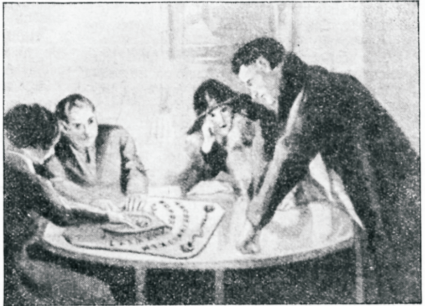
Kirjalikkude teadete saamine waimudelt teatud tähestitu kaudu.

wõrku. Kui temale on tartwilit, siis lasseb ta seda pettufena awalduda neile, kes ei taha uskuda üleloomulistesfe jõududesfe, et neid edasi uskmatuses pidada wõi weel sügawamale langeda lasta. Mitte harwa ei pühenda teaduse autoriteedid end selleks, et temale selles oma abi pakuda, kuna nad tihti, hoolimata kindlateft uurimistulemustest, kirjutawad artiklid parema weendumise wastu ja lasewad ajalehtedes awaldada