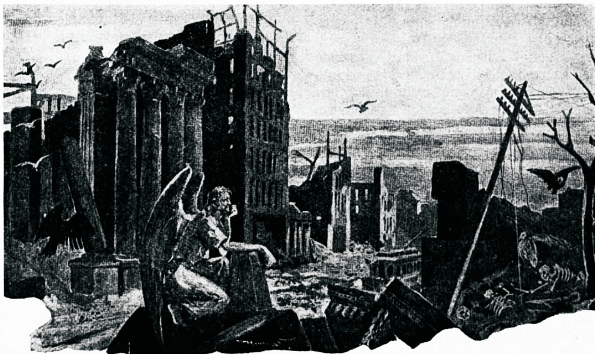
Oluford, millisesse saatan tahab juhtida maailma.

saadetakse terwena wälja. Teda oli terweks teinud täielik eemalhoid selle rahutu maailma sündmusist. Üksheoidja on muretsenud auto. Ennesõjaaegse harjumuse järgi küsib sõita soowija: „Mis maksab sõit jaamani?“ „2000 marka“, wastab autojuht. Küsija kahwatub. See nagu naelutab finni ta keele. Ta kobab taskust ning toob lõpuks ühe kuld- raha päewawalgele. „Kafstuhat marka,“ mõtleb ta, „mul on waid kümmemargaline“. Autojuht fil- mab kallist eset teise käes ning mõtleb: „Tänapäe- wase kulla müügihinna järgi saab sellest oma 8000 marka kätte.“ Mees waatab hetke järelemõeldes omaette, pöörab siis sammud haiglasje tagasi ning